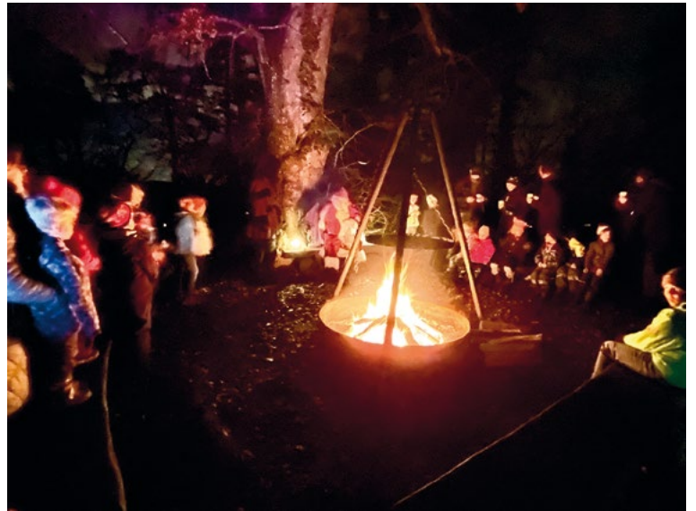
Der Feuerwehrverein Buchberg-Rüdlingen veranstaltete am 6.12.25 eine «Waldete» auf dem Hurbig. Über 40 Kinder waren angemeldet und warteten gespannt auf den Samichlaus, begleitet vom Schmutzli. Jedes Kind bekam ein Chlaussäckli. Sie und die Begleitpersonen, insgesamt waren es um die 80 Personen, hatten Riesenspass. Für den grössten Hunger gab es Würste vom Grill und allerlei Knabbereien. Die Kinderwagen der Kleinsten waren zwar festlich beleuchtet und den Weg zum und vom Hurbigwald hinunter ins Dorf musste man im Dunkeln mit der Taschenlampe oder dem Handy-Licht aufspüren.