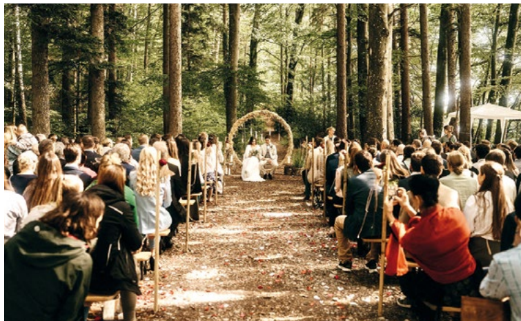
Trauung auf einer Waldlichtung im Tösstal