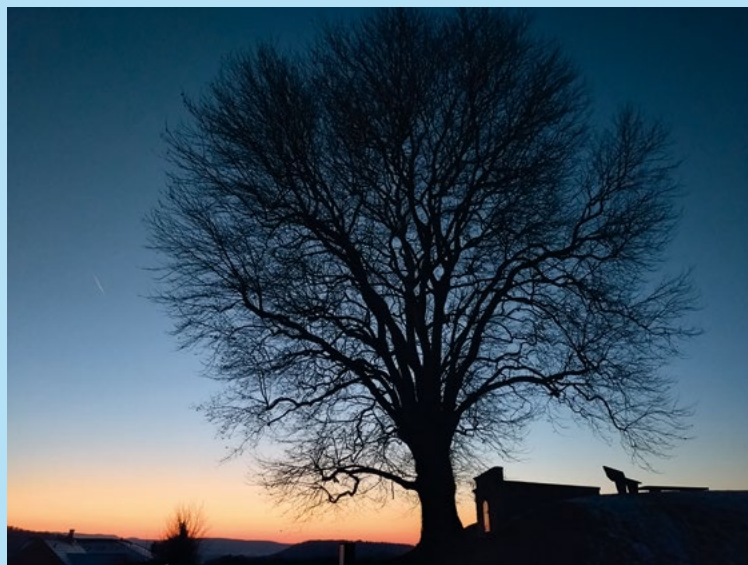
Reservoir seit 1908 Platte Buchberg

ferten 170 Liter Wasser pro Minute. In einer Druckleitung mit 90 Meter Gefälle war geplant, dass die Widder davon 50 Liter ins Reservoir knapp 200 Meter hoch fördern würden. Leider blieb die Leistung enttäuschend tief, bei 26-30 Litern pro Minute. Zudem kam es infolge der hohen Wasserdrücke und der Schläge der Widder immer wieder zu Leitungsbrüchen, mit der Folge, dass die Leitungen in der steilen Rheinhalde ausgeschwemmt wurden, wenn wieder einmal das ganze Reservoir ausfloss. Das Projekt wurde ein Viertel teurer als der Voranschlag. Bund und Kanton bezahlten 48 %, die Gemeinde 39 % und die Hausbesitzer 13 % der Bausumme. Für die damalige Zeit war es ein Vorzeigeprojekt und galt als eines der grössten mit der höchsten Förderhöhe in der Ostschweiz.