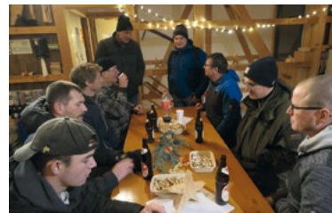
Intensive Gespräche unter Vereinskollegen