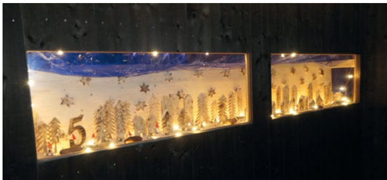
Ein goldig leuchtender Tannenwald mit Sternenhimmel von Peter Baumann unter Mithilfe von Rahel Häderli

Am Freitag, 5. Dezember, kam eine grosse Schar Besucher in die Gattersagi. Das von Peter Baumann unter Mithilfe von Rahel Häderli entworfene und liebevoll gestaltete Adventsfenster wurde eröffnet. Ein dichter Tannenwald mit Sternenhimmel, im Winterlook dekoriert und dezent beleuchtet, präsentierte wunderschön. Die Festwirte glänzten einmal mehr mit feiner Heidasuppe und Glühwein. Intensive Gespräche der Gäste bis spätabends haben die festlich geschmückte Gattersagi, trotz Kälte draussen, heimelig erscheinen lassen. Herzlichen Dank an alle, die den festlichen Anlass ermöglicht haben.