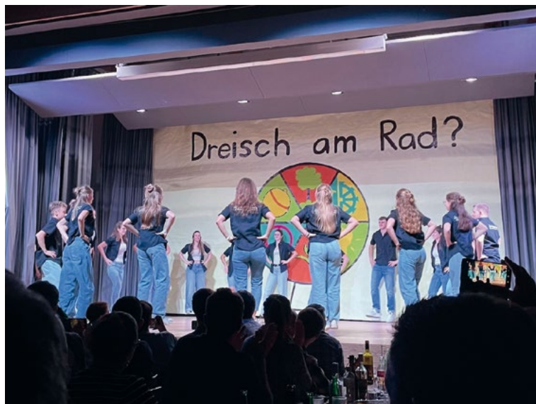
Einige Eindrücke der Darbietungen

Zuerst waren die Kleinsten vom Kinderturnen (KITU) an der Reihe mit einem fröhlichen und ansprechenden Tanz. Daraufhin folgte der Auftritt der Jugendriege mit dem Titel «Zeitmagiene» (zusammengesetzt aus Zeitmaschine und Magie). Die kleinen Dinosaurier der Mädchenriege folgten und wurden abgelöst von der Jugendriege mit einem Auftritt rund um das Jahr 1839. Es folgten die Kinder der Abteilung Geräteturnen, die ihr Können auf dem Trampolin und am Barren unter Beweis stellten. Den Abschluss der ersten Hälfte machte die Mädchenriege mit einem tollen Tänzchen. Nach der grossen Pause, bei welcher die Mitwirkenden und die Gäste sich ein bisschen erfrischen konnten, ging es weiter mit dem Auftritt des Gastvereins aus der Nachbargemeinde Flaach. Die Ladies begeisterten das Publikum mit einem gekonnten und verführerischen Tanz mit dem Titel «Chrüsümüsi». Daraufhin folgten die TV-Frauen mit «Chatzemusig» und die TV-Männer mit «QuadRad», beides tolle Auftritte, welche mit tosendem Applaus verdankt wurden. Danach gab es eine Darbietung des Frauentur-