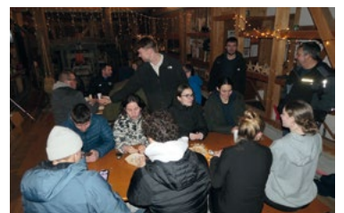
Festliche Stimmung spätabends anlässlich der Eröffnung des Adventsfensters in der Gattersagi