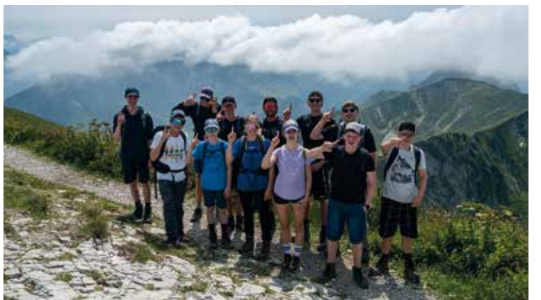
Eindrücke vom Fun and Sports 2025