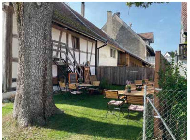
Ein lauschiger Garten lädt an schönen Sommerabenden ein