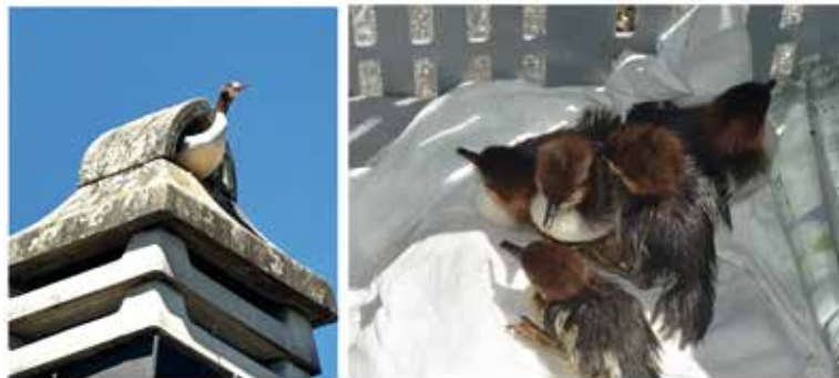
Die Gänsesäger-Mutter und ihre Küken

Zurück im Tierheim Pfötli gab es eine Führung durch das Tierheim; die Büros, das Sitzungszimmer, die Küche und den Aufenthalts-