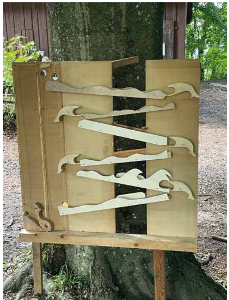
Alains Bahn wurde erst am Vorabend kurz vor Mitternacht fertig.