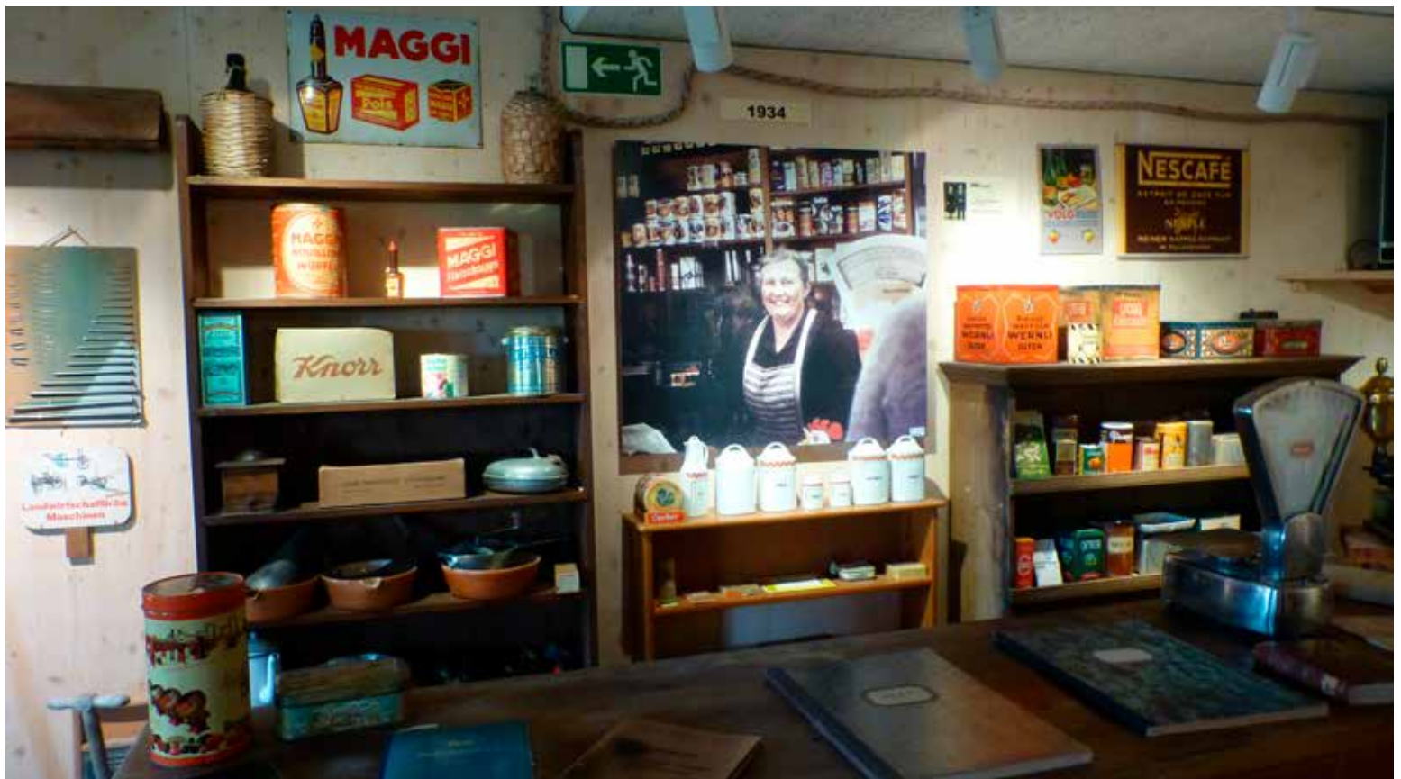
Die Laden-Anna, wie sie liebte und lebte, wenn sie die Kunden begrüßte: Wer die Geschäftsführerin des Konsum-Ladens noch kannte, als sie hinter dem Verkaufstisch stand, war verblüfft, sie in Leibesgrösse vor sich zu sehen.

Das Ziel der Gründung des Handwerksmuseums war ein bleibendes Daheim für die Gattersagi. Doch Buchberg hat viel mehr bekommen als einfach eine Heimat für die historische Säge: Dank den wechselnden Ausstellungen lebt das Museum.