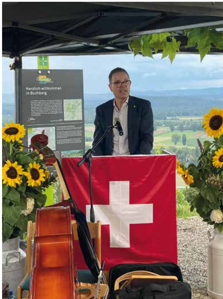
Dino Tamagni, Regierungsrat Schaffhausen, spricht über die Herausforderungen in der Schweiz: «es geht immer um de Stutz»

Nachdem der Redner über die Konflikte und Unsicherheiten in der Weltpolitik gesprochen hatte, äusserte er sich auch über die Herausforderungen in der Schweiz, vor allem über die Geldpolitik: «es geht immer um de Stutz». Die Kosten für die Landesverteidigung würden steigen, aber auch alle anderen Ausgaben, daher sei der Dialog zwischen dem Bund und den Kantonen äusserst wichtig, damit man gemeinsam eine Lösung finden und sich auf das