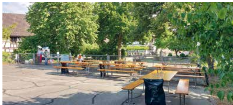
Alles vorbereitet

Lasst uns gemeinsam weitermachen – für eine bewegte Zukunft auf der neuen Tartanbahn!