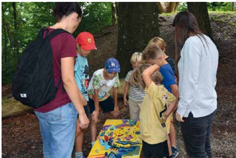
Bunte Bahn der zweiten Primarschulklasse