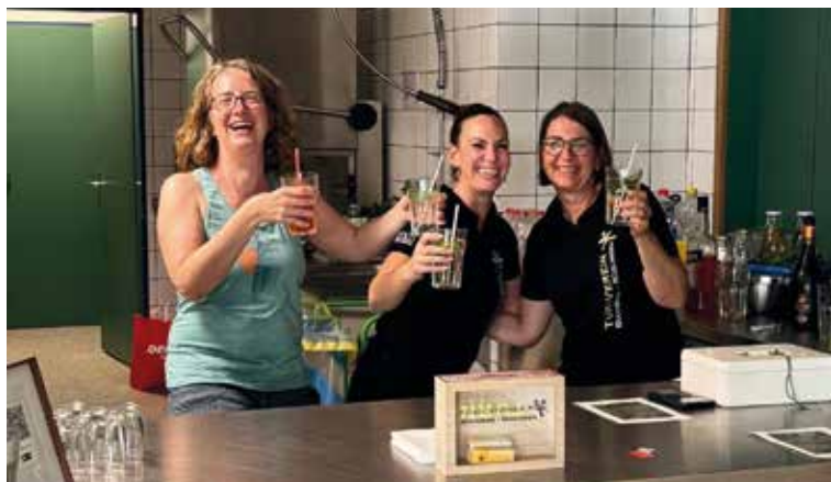
Weiter so!

Die Rückmeldungen waren durchwegs positiv – und genau das ist unser Antrieb, weiterzumachen!