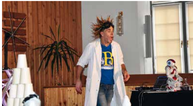
Professor Bummbastic überrascht Kinder und Erwachsene mit seinen wissenschaftlichen Experimenten

welche der Raketen abgefeuert werden sollte. Zur Wahl standen eine ganz kleine, eine mittelgrosse und eine ganz grosse, welche jedoch im Kofferraum seines Wagens verstaut sei. Man einigte sich darauf, die mittlere abzufeuern, da die grosse zu gefährlich gewesen und wahrscheinlich bis nach Schaffhausen geflogen wäre.