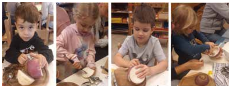
Eifriges Schnitzen

men immer leiser. Einige Ráben wurden von den Kerzenflammen weich gegart und fielen auseinander oder die Kerzen waren ausgelöscht. Aber als alle in einem grossen Kreis um die leuchtenden Kürbisse versammelt waren, sangen wir noch einmal mit lauten Stimmen: