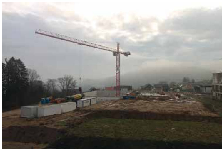
Generationenprojekt Mehrzweckhalle am 2.12.24.

relangen Bauarbeiten die neue Brücke «Point de vue» der Bänziger Partner AG aus Zürich eingeweiht.