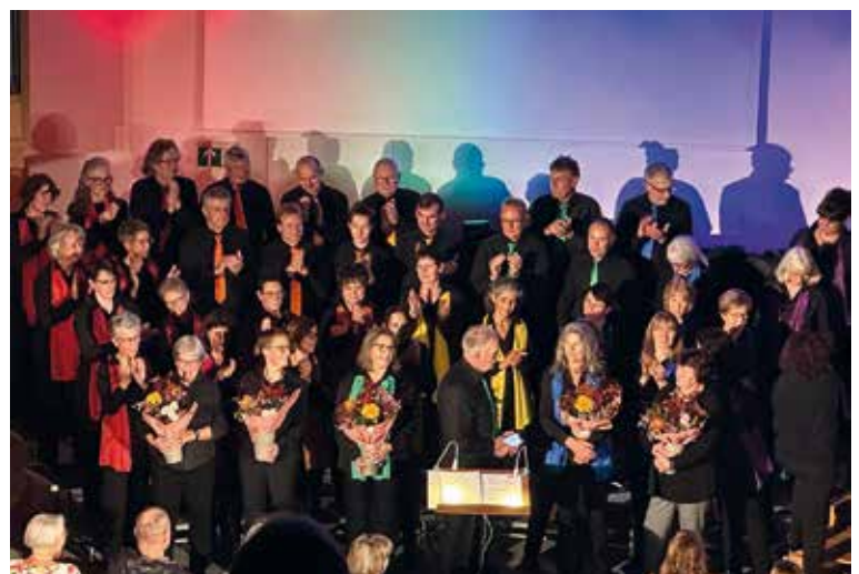
Anlässlich des 20jährigen Jubiläums gab es 3 wunderbare Konzerte