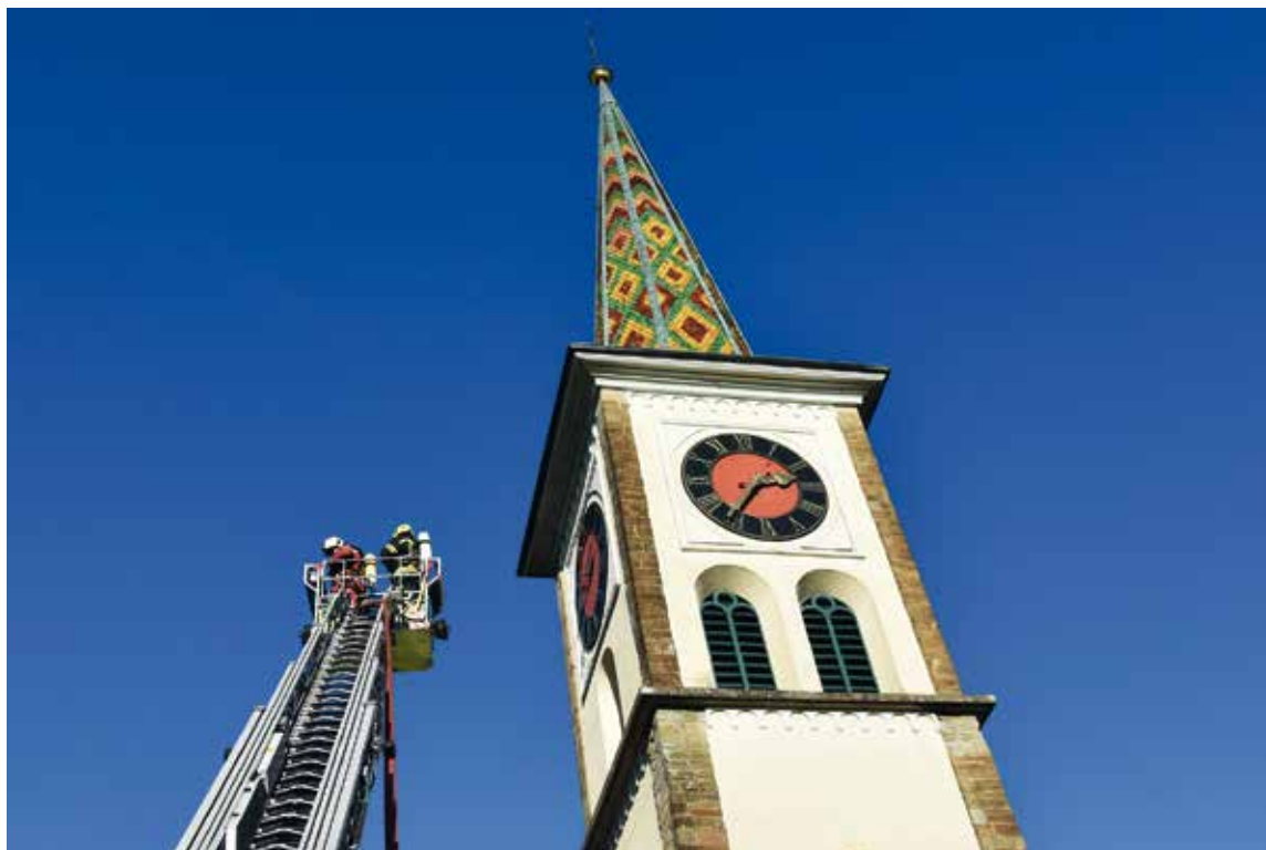
Es galt eine verletzte Person aus dem Dachstock zu retten

Am Samstag, 16. November, fand bei strahlendem Herbstwetter die alljährliche Hauptübung des WUK (Wehrdienstverband Unterer Kantonsteil) statt. Austragungsort war die Kirche Buchberg-Rüdlingen, die sich bestens für dieses Training eignete. Die Übung ging wie folgt vonstatten: