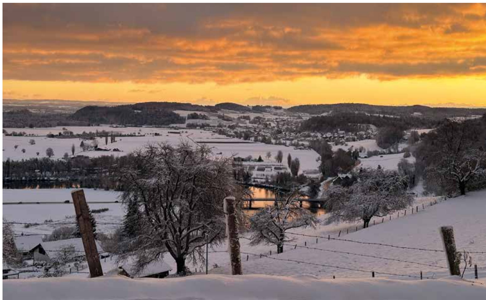
Der November bescherte uns einen überraschenden Schneetag