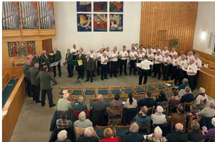
Die Jagdhornbläsergruppe «Stadtforen Eglisau» und der Männerchor Buchberg unterhalten das zahlreich erschienene Publikum

von einem slawischen Stück mit dem Titel «Tible Pajom». Mit diesen ruhigen und melancholischen Liedern nahmen die Sänger zudem Abschied von zwei verstorbenen Kameraden, deren Stimmen für immer in der Gemeinschaft des Chores fehlen werden. Im Anschluss spielte die Jagdhornbläsergruppe «Stadtforen Eglisau», zusammengesetzt aus acht «First-Pless» und fünf «Parforce» Hörnern, unter der Leitung von Max Altenburger, den «Stadtforen» und den «Hubertus» Marsch, gefolgt von der «Ehrenfanfare» und dem bekannten und beliebten «Jäger aus Kurpfalz».