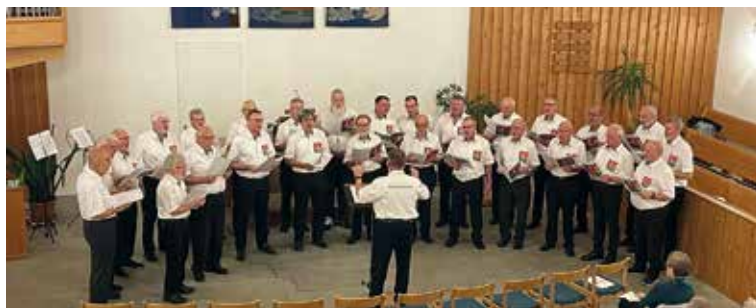
Der Männerchor in Aktion