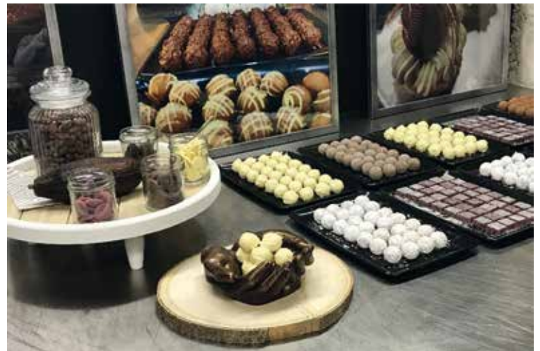
Pralinen herstellen bei Tattis in Diessenhofen