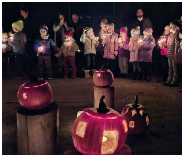
Ein gelungener Anlass für die Kleinen, die stolz ihre Ráben präsentierten.

weiteren Begleitpersonen. So schön, dass Sie alle dabei waren und unserem Räbeliechtliumzug zu einem festlichen Anlass verholten haben. Danke.