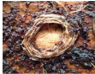
Leere Puppenwiege des Schrotbocks an einem Föhrenstamm nach dem Ablösen der Rinde.

Seit dem Frühling lagen zwei Föhrenstämme in Rinde vor der Gattersagi. Bereit, gesägt zu werden. Das geschah erst am Sagi-Fisch. Kurz davor lösten wir einige grössere Stücke der Rinde vom Stamm. Darunter fanden wir eine Vielzahl von runden Käfernestern, genannt Puppenwiegen des Schrotbocks. Die Eiablage muss im Frühjahr erfolgt sein. Im ca. 2,5 cm grossen, runden Nest entwickelt sich die Larve. Diese verpuppt sich und entwickelt sich bis im Herbst zum Käfer. Dieser überwintert im geschützten Umfeld.