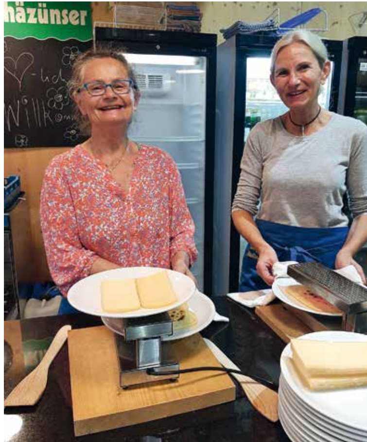
Eindrücke vom Racletteplausch.