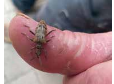
Schrotbock, lat. Rhagium inquisitor, oder Kleiner (Kiefer)Zangenbock an einem Daumen