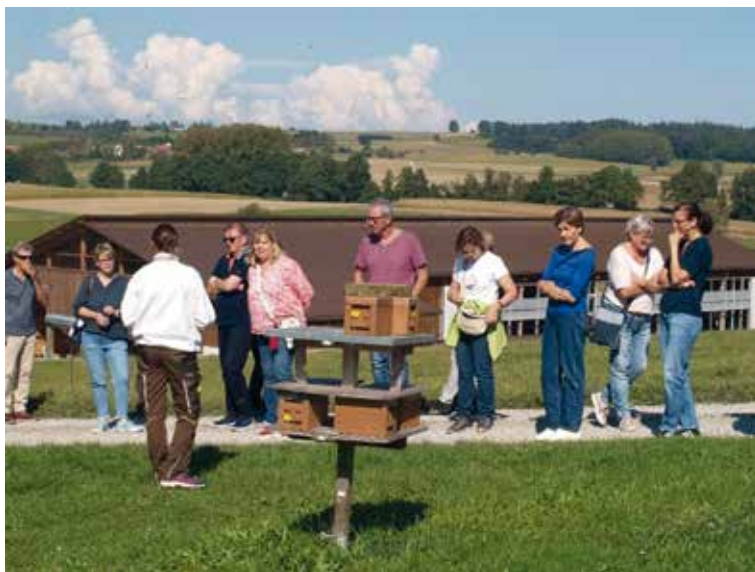
Auch die Männer der Landfrauen Rüdlingen waren dieses Mal eingeladen.

Das grosse Verständnis von den beiden Bienenkennerinnen ihren Tieren gegenüber zeigt sich auch