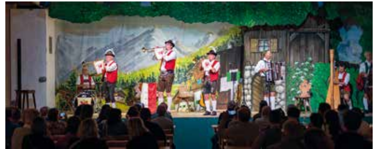
Tiroler Chränzli inkl. Schuhplattlern und Jodeln

Der Samstag stand im Zeichen der Tiroler Genüsse – sowohl in fester als auch in flüssiger Form. Nach einem gemütlichen Vormittag teilten wir uns in zwei Gruppen auf. Die einen machten sich auf zu einer Food-Tour durch Innsbruck, während die anderen eine Brauerei besuchten. Der Abend brachte dann das Highlight des Tages: Ein traditioneller Tiroler Abend – oder wie wir es zu sagen pflegten – ein Tiroler Chränzli, inklusive Schuhplattlern, Jodeln und jeder Menge Tiroler Folklore. Doch damit nicht ge-