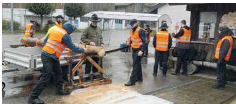
Die Schüler der Polizeischule liessen sich vom Regen kaum stören.