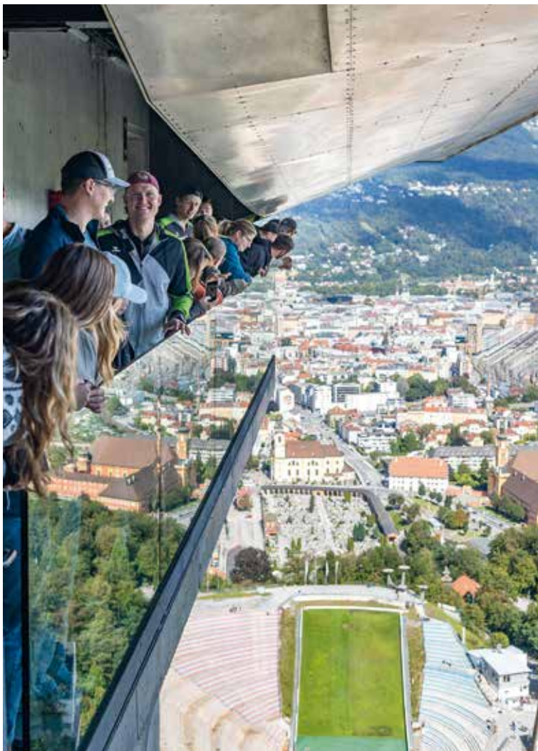
Im Sky Restaurant mit Blick auf die Skisprungschanze in Innsbruck