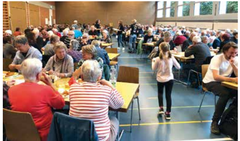
Eine vollbesetzte Mehrzweckhalle in Buchberg am Fischsonntag der Gattersagi