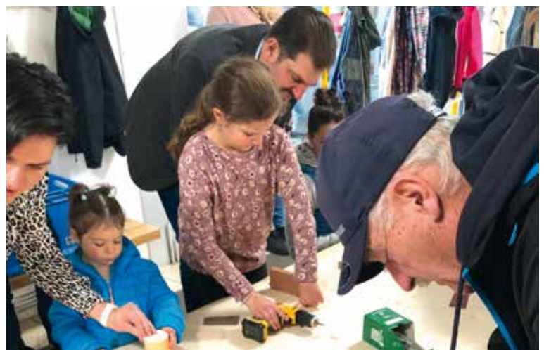
Kinder basteln unter Anleitung ihr eigenes Holzauto.