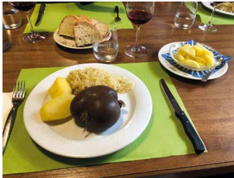
Wenn dann richtig: Blutwurst, Herdöpfel, Sauerkraut und Öpfelstückli, mein Klassiker im Steinenkreuz!