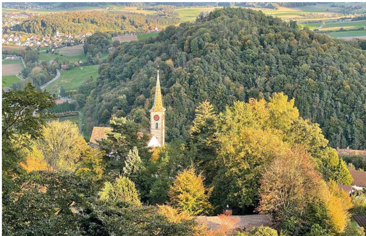
Kein neuer Anblick, aber in dieser farbenfrohen Umgebung atemberaubend schön!