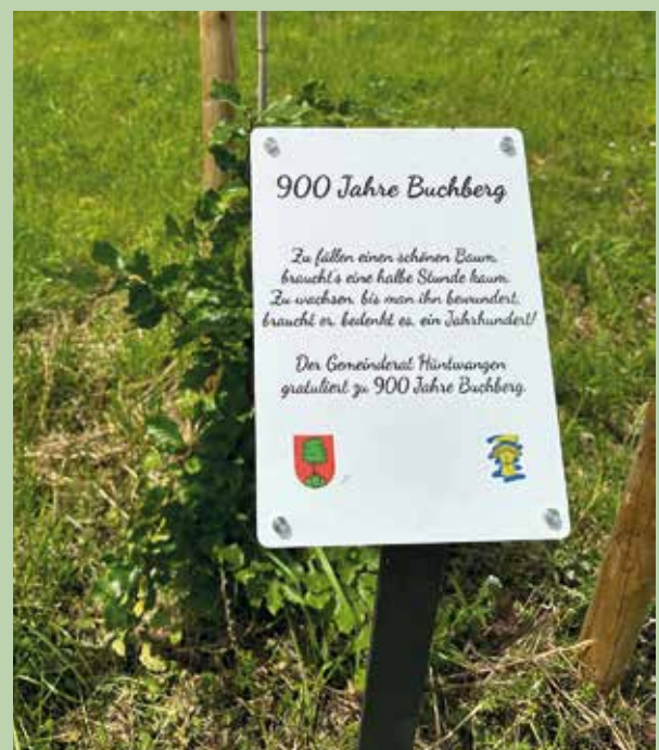
Wer weiss, wo dieses Geschenk der Gemeinde Hüntwangen steht? Die kleine Buche entwickelt sich prächtig!