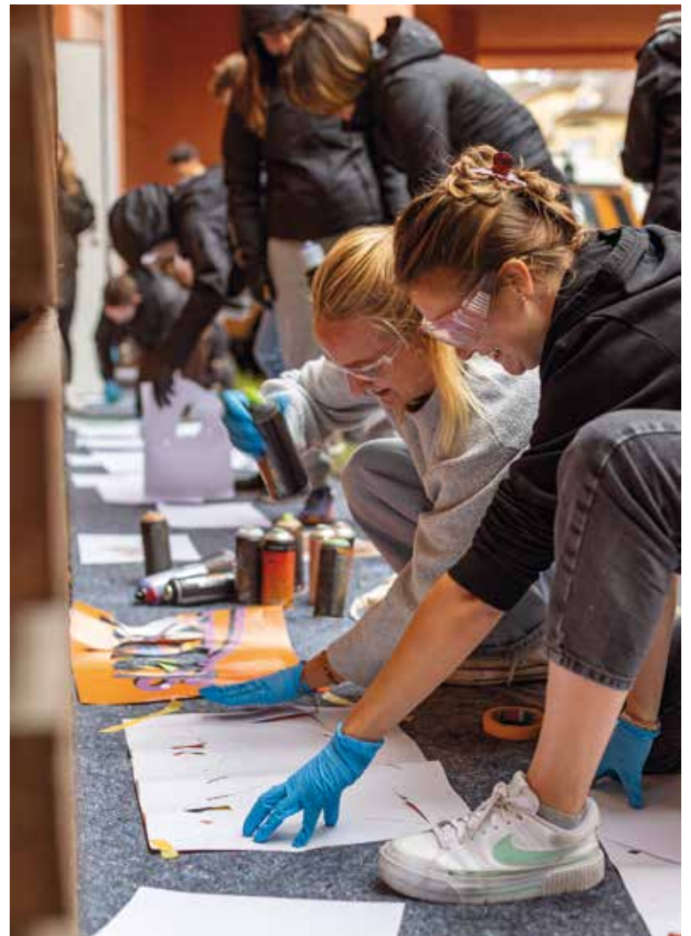
Beim Graffiti-Kurs konnte die Kreativität ausgelebt werden