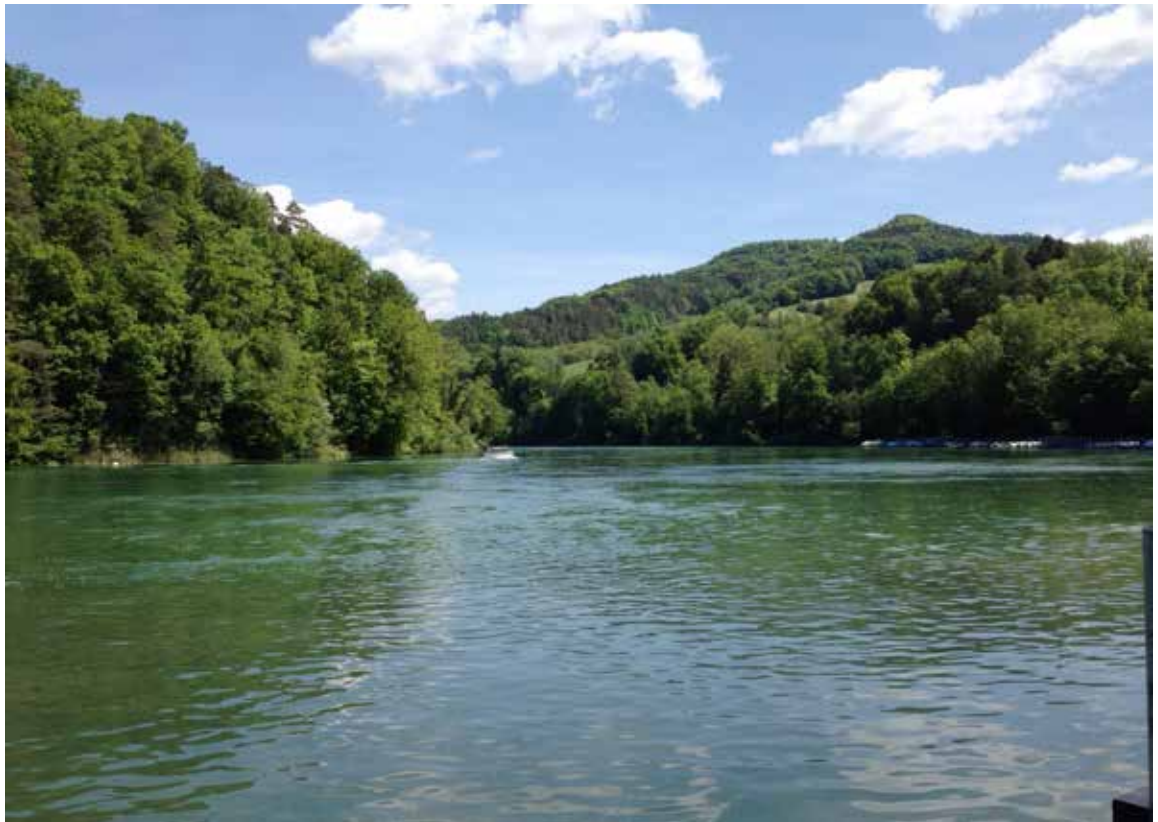
Aus der angedachten Hängebrücke für Wanderer von Buchberg nach Tössegg wird nichts. - Und so benutzen wir halt weiterhin die kleine Fähre (Bild lb)

Im Mai 2018 präsentierte die IG Pilgersteg Tössegg den Gemeinden Buchberg und Eglisau und den Kantonen Zürich und Schaffhausen eine Vorstudie für eine mögliche Rheinquerung für Fussgängerinnen und Fussgänger in der Tössegg. Die Idee basierte auf einem Bericht über einen historischen Fussweg, der um 1850 die beiden Gemeinden an dieser Stelle miteinander verband. Die betroffenen Gemeinden und Kantone zeigten sich gegenüber dieser Idee offen und interessiert. Sie gaben eine Machbarkeitsstudie in Auftrag, in der nebst der vorgeschlagenen Variante der IG Pilgersteg Tössegg sechs weitere Haupt- und zwei Untervarianten geprüft wurden. Aus technischen Gründen, aber auch aus Überlegungen des Natur- und Landschaftsschutzes, wurden aus-