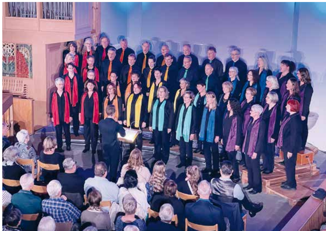
Der Rainbowchor feiert sein Jubiläumskonzert in vollbestzter Kriche