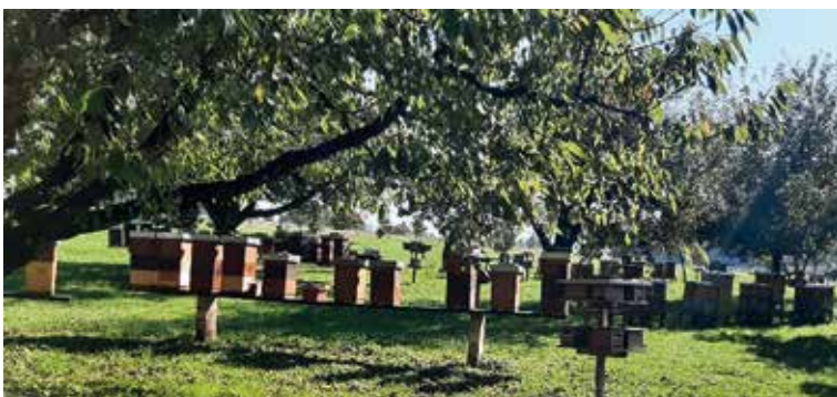
Wenn es den Bienen gut geht und sie wohl genährt sind, sind sie friedlich.

nenvölker als auch für Königinnen. Hoch interessant, wie ein Bienenstaat ohne Königin das offenbar merkt, dass sie ihnen fehlt, und anfängt eine Königin zu züchten. Wenn die Imkerinnen eine Königin an einen Kunden versenden, dann bekommt die Königin zuerst eine Markierung, damit auch die Hobby-Imker die Königin in ihrem Bienenstock wieder finden. Für das Versenden in einer kleinen Schachtel, die in einem Couvert der Post übergeben wird, bekommt die Königin aber ganz ihrem Stand entsprechend noch eine Hofdame mit auf den Weg,