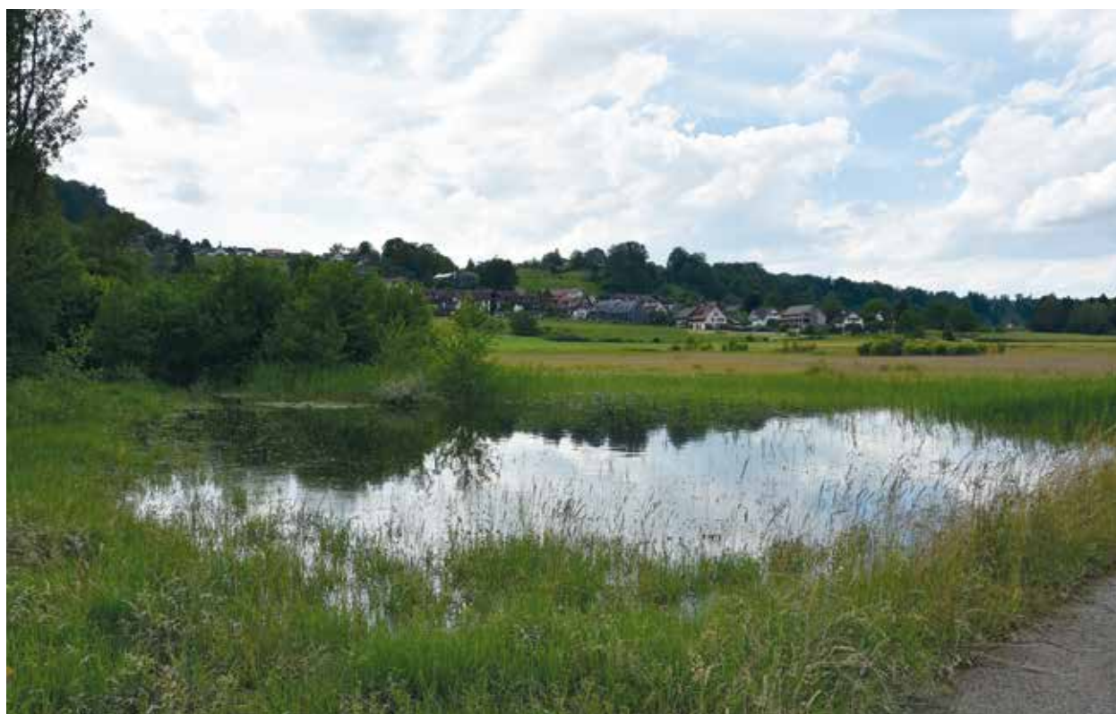
Rüdlingen am See - von Janine Dean