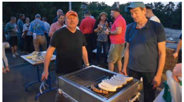
Im Anschluss wurden Getränke und Bratwürste serviert.