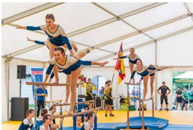
Nachfolgend einige Eindrücke von den verschiedenen Anlässen

Als das TK von der Möglichkeit, ans Turnfest Buchberg zu reisen, erfuhr, war die Entscheidung grundsätzlich bereits gefallen: Dies soll unser Hauptturnfest werden. Mit einer beeindruckenden Delegation durften wir den Weg in den Kanton Solothurn antreten. Wir fanden ein hervorragend organisiertes Fest vor, was uns sehr zuversichtlich für eine gute turnerische Leistung stimmte. Leider war das Wetter an diesem Turnfest nicht auf unserer Seite und der Dauerregen liess Top-Leistungen nur sehr bedingt zu. Wir durften dennoch einige herausragende Resultate feiern. Um sich mit den Gerätevereinen zu messen, reichte das Gesamtergebnis aber leider nicht ganz. Dennoch reisten wir mit einem guten Gefühl nach Hause, da trotz der schwie-