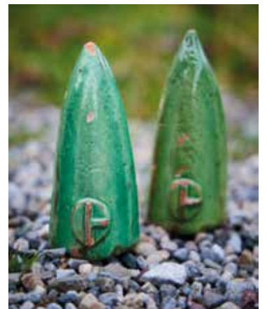
Keramik-Pfeile mit Gemeindewappen wurden als «Zeugen» unter Grenzsteinen vergeben

systems verschwanden die alten Hohlmasse, nach und nach auch das Wissen um den Ursprung des Rüdlinger «Ringgen». Viele sahen darin das steinerne Kreuz, andere ein Müllrad, eine Sonne, eine Fähre, eine Brezel, eine Fibel (Schliesse, Gewandnadel). Auf einer Vereinsfahne, im Schützenhaus sichtbar, ist das Wappen als Gürtelschnalle interpretiert. Dieser Wirrwarr führte schliesslich dazu, dass 1949 ein neues Wappen offiziell wurde.