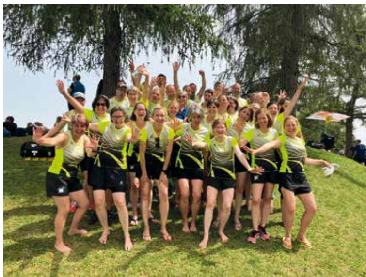
Das Frauenturnen-Team