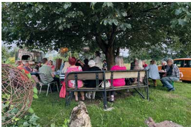
Interessierte Zuhörer unter dem schatten- (oder Schutz vor Regen?) spendenden Nussbaum

es bereits am Anfang des Buches eine Leiche, jedoch beginnt damit eine Geschichte über die Stadt Zürich, den See, die Flüsse, die geheimen Gärten, Häuser, Hinterhöfe und Plätze in der Altstadt und im Niederdorf, sowie die geschichtlichen Hintergründe, welche die alt eingesessene Zürcherinnen und Zürcher prägen. Zudem spielt die Handlung an der Zürcher Goldküste und nimmt