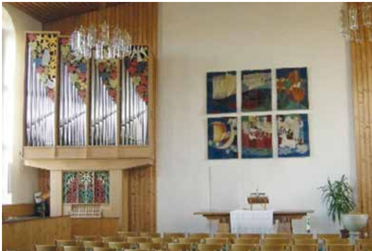
Rechts die Wandteppiche in der Kirche

Dora Sieber erinnert sich: «...Diese wurden in entsprechenden Farben «gedüntelt» und nachher aufgenäht. Wir trafen uns nach der Einwei-