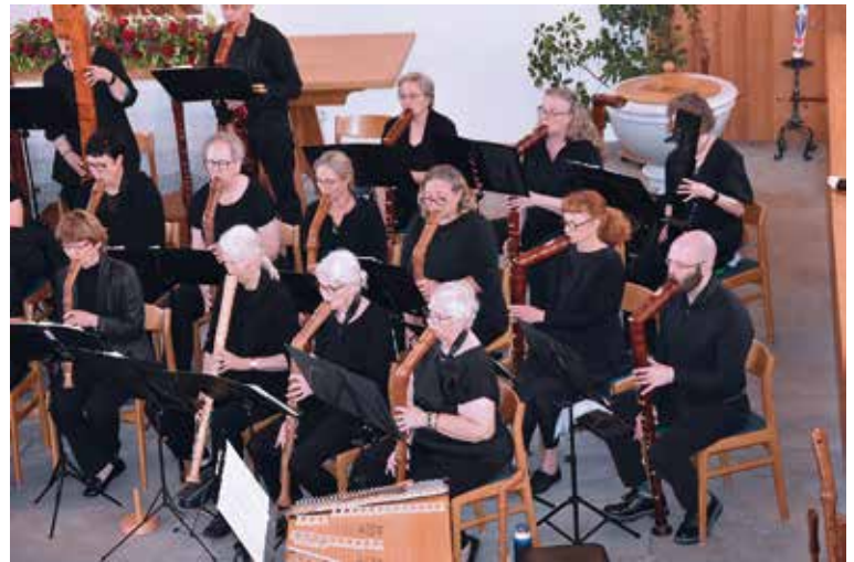
Die Vielfalt an Flöten ist faszinierend... Bilder von jd

wirkenden, die Instrumente sowie die aufgeführten Werke.