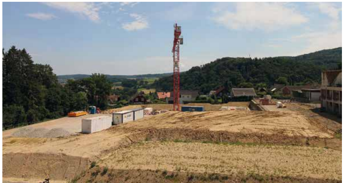
Baufortschritt per Dato 21.07.2024

Die Aushubarbeiten sind beendet und der Kran ist aufgerichtet. Unser Tipp: Unter dem Link https://feed.yellow.camera/EL663P43D können Sie jederzeit den Baufortschritt mit der Zeitrafferkamera verfolgen.