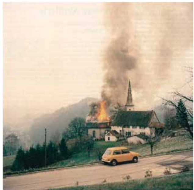
Küßlingen, 16. November 1972

Am 19. November 1972 brannte die alte Kirche