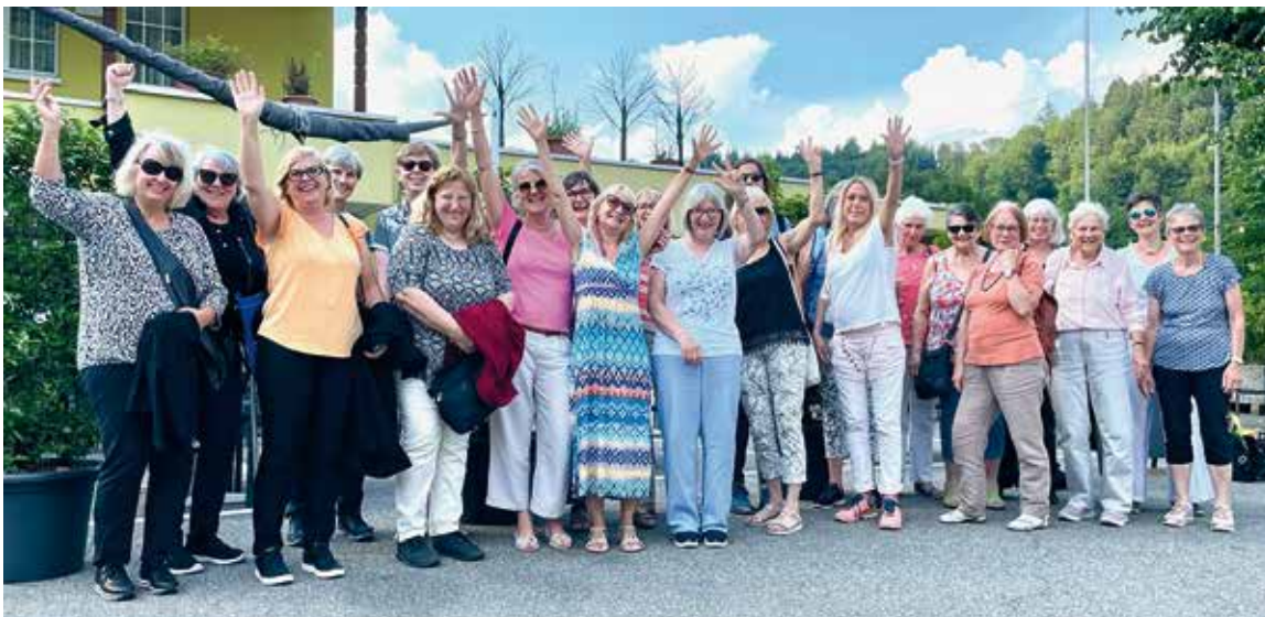
Gutgelaunte Landfrauen-Truppe

Da das Entlebuch bekannt ist für seinen Reichtum an Steinpilzen, konnte Bruno Hafner ein Abkommen mit der Luzerner Kantonspolizei schliessen. Die Pilztouristen aus der Schweiz und aus Italien dürfen nur ein Kilogramm Steinpilze mitnehmen und alle weiteren Mengen werden konfisziert und müssen entsorgt werden. Es kann vorkommen, dass bis zu 20 Kilogramm an einem einzigen Tag anfallen. Die Polizei kontaktiert jeweils die Teigwarenfabrik und Hafner bietet seine Helferinnen und Helfer auf, um die grosse Menge verarbeiten zu können. Nachdem ein Pilzkontrolleur diese begutachtet hat, werden sie zu Pulver verarbeitet, um später für Steinpilz-Ravioli oder trockene Teigwaren verwendet zu werden.