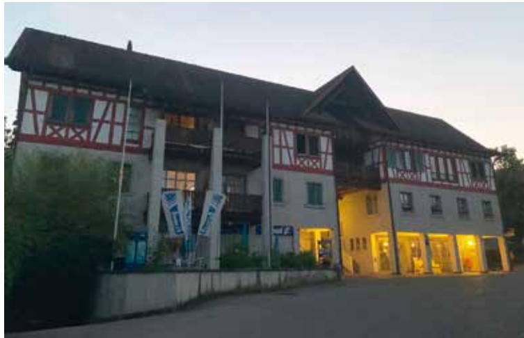
Im 1992 eingeweihten Rüdlinger Gemeindehaus stehen Änderungen an.

dass der Verkauf der beiden Gebäude noch nicht spruchreif sei. Bevor es zu einer Entscheidung komme, werde man die Bevölkerung einbeziehen – etwa im Rahmen eines Infoanlasses. Das letzte Wort werde die Gemeindeversammlung haben.