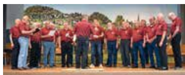
Der Männerchor mit neuen Poloshirts

Am Fyyraabigkonzert trugen wir erstmals die neuen Poloshirts, die