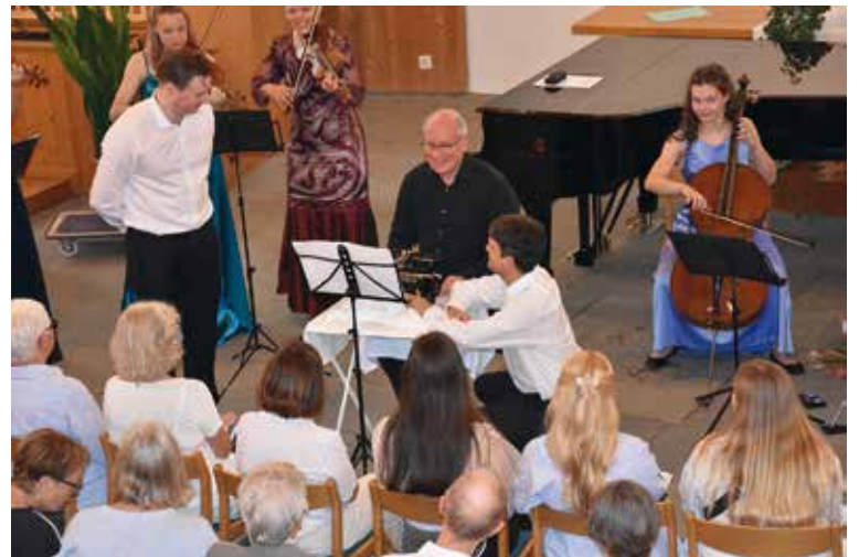
Sogar eine alte Schreibmaschine kam zum Einsatz.

Das diesjährige Buchberg Classix war wieder ein voller Erfolg und Klassische-Musik-Begeisterte freuen sich bereits jetzt wieder auf ein weiteres Musik-Festival im neuen Jahr. Dies im vollen