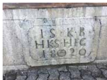
Stilisierte Sester auf einem Dorfbrunnen von 1820

der amtlichen Eichung festgeschraubt. Beim Messen von Schüttgut wurde der Kübel jeweils etwas überfüllt, dann wurden die überschüssigen Körner mit einem Lineal (Holzlatte) abgestreift. Das Mass war dann gestrichen voll. Als Redensart ist dieser Zustand besser erhalten geblieben als mein «Sester», den ich vor Zeiten in Rüdlingen erstanden habe. Dieser, geeicht 1857, ist defekt, verwurmt, rostig. Ich halte ihn aber in Ehren weil die stilisierte Darstellung eines «Sesters» einst das Wappen von Rüdlingen war.