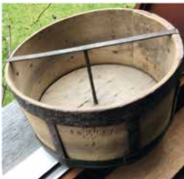
Sester von 1857, mit amtlichen Eichzeichen CS (Canton Schaffhausen)