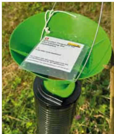
Japankäferfalle in Buchberg

Zur Zeit kann man in der Region solche Japankäfer-Fallen sehen. Sie sollen ein sofortiges Entdecken und Bekämpfen ermöglichen, falls diese bei uns auftauchen.