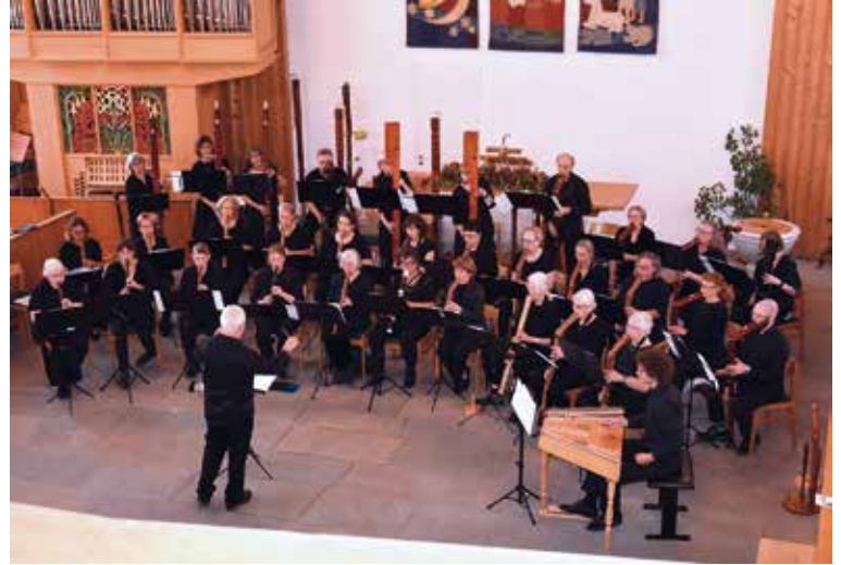
Das Conttato Blockflötenorchester