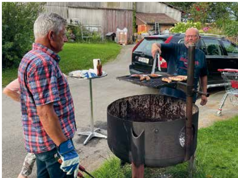
Auch für das leibliche Wohl wurde gesorgt.