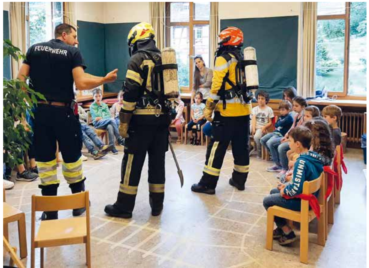
Gebannte Zuhörer im Kindergarten

Beim Zeigen blieb es nicht, es wurde dann auch sogleich das Gehörte geübt, indem der Chindsgi evakuiert wurde. Das hat super geklappt, alle haben sich grosse Mühe gegeben. An-