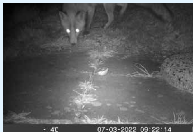
Die zahlreichen Füchse in unserer Nachbarschaft sind nachts zwischen den Wohnhäusern auf Futtersuche unterwegs. Bitte achten Sie darauf, dass keine Speisereste herumliegen, welche die Wildtiere anlocken können. Im Vordergrund dieses Bildes liegt ein halber Apfel. Er wurde für die Amseln hingelegt, doch diese hatten gerade keine Appetit auf Apfel. Am folgenden Morgen war er verschwunden. Welches Tier hat nachts Lust auf Äpfel? Es war tatsächlich der Fuchs, der den Apfel geholt hat!