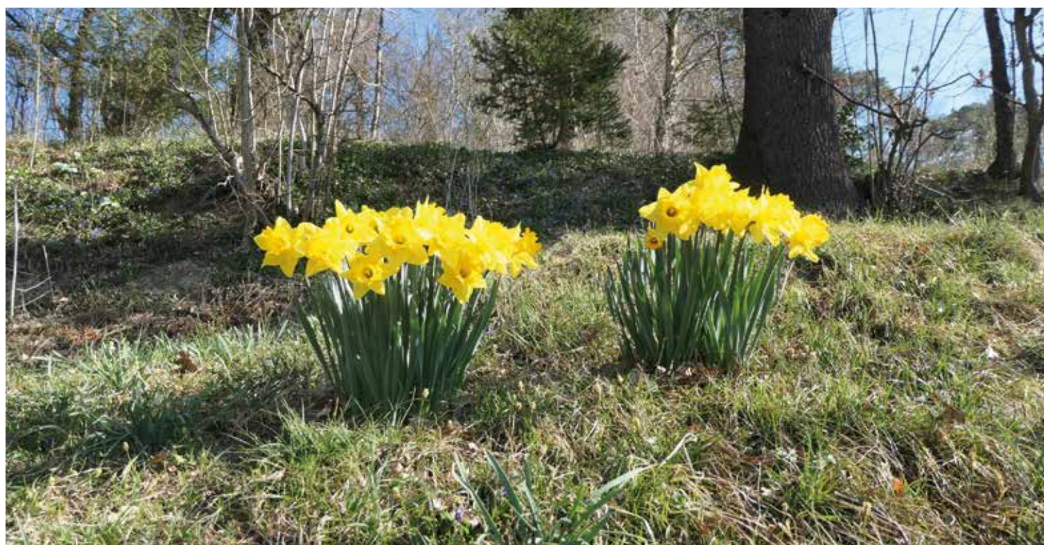
Lange hat es gedauert dieses Jahr, bis sich die ersten Frühlingsboten zeigten, aber nun sind sie da!