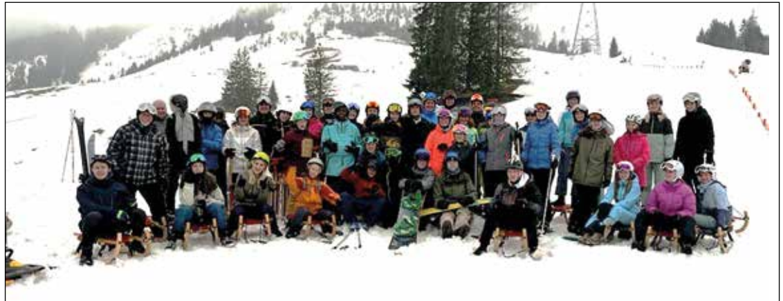
Die Schüler und Schülerinnen der 3. OS Buchberg und Rüdlingen

Auch dieses Jahr konnte das traditionelle Skilager nicht stattfinden, was uns alle etwas traurig stimmte. In den Skiferien entstand dann plötzlich die Idee, einen Schneesporttag als Alternative ins Leben zu rufen. Kurzentschlossen wurde die Schulbehörde angefragt und uns wurde die Bewilligung für einen Tag im Schnee erteilt. Juhu! Am 18. März 2022 war es so weit und die gesamte OS fuhr per Car nach Unterwasser, um im Skigebiet Chäserrugg einen Tag