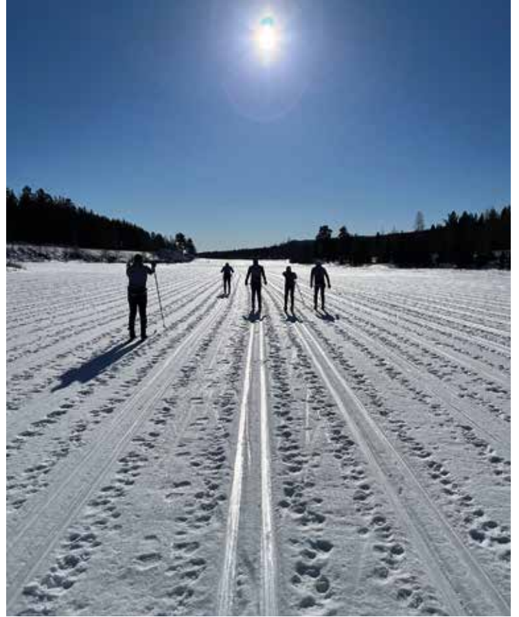
Tolle Leistung der Läufer aus dem schaffhauserischen Unterland

Aus «ferner liefen» wurden Platzierungen in den ersten 5% der Teilnehmer. Grossartig.