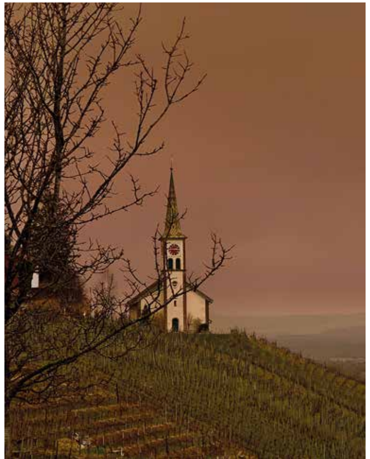
Die Kirche von Buchberg und Rüdlingen am 15. März 2022

Dieser Effekt auf das Wetter kann dazu führen, dass die Höchsttemperaturen niedriger ausfallen als ursprünglich vorhergesagt.