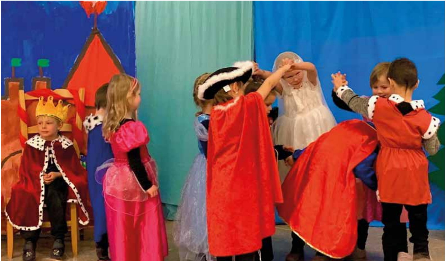
Die Kindergartenkinder sind mit grossem Eifer beim Hochzeitstanz der Prinzessin und dem tapferen Schneiderlein