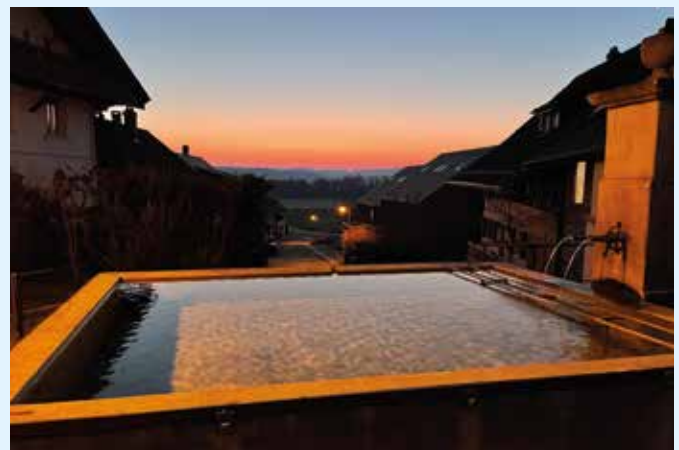
Timo Rüeger aus Rüdlingen hat uns diese wunderschöne Morgenstimmung zukommen lassen

Marc Bär, Sandgrubenhalle 12; Erstellen eines Parkplatzes beim Gebäude VS Nr. 315 auf dem Grundstück GB Rüdlingen Nr. 665