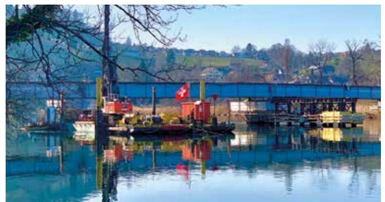
Die Brückenbaustelle am 28. März 2022

über Teufen, Rorbas, Eglisau eingerichtet.