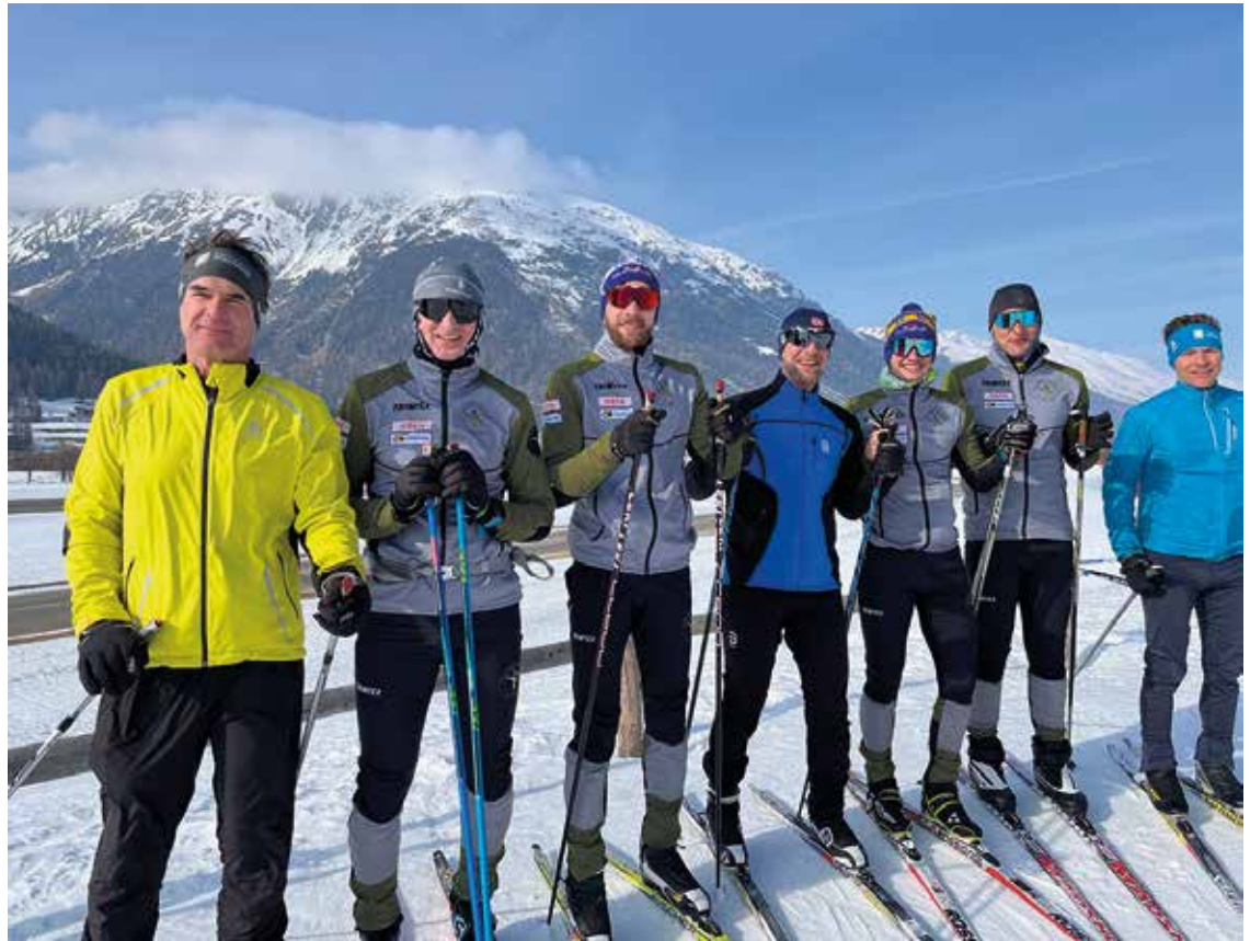
Das Team aus Buchberg und Rüdlingen

auch die Langlaufwelt. Absage folgte auf Absage, man versuchte das Training in der Natur zu geniessen. Dennoch fehlten die Rennen, die «Pferde» im Stall begannen zu scharren. So wurde im 2021 der Entscheid gefasst, sich im Frühjahr 2022 nochmals an den legendären Wasalauf zu wagen. Flüge und Unterkunft wurden gebucht und die Ehefrauen und Freundinnen über das neuerliche Abenteuer unterrichtet.