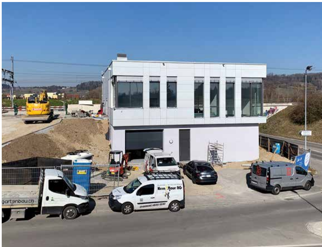
Das Kryonik-Zentrum kurz vor der Vollendung

Wenige Meter vom Bahnhof Rafz entsteht für 3 Millionen Franken ein hochmodernes Technologiezentrum. Bauherrin ist die European Biostasis Foundation (EBF). Die EBF ist eine steuerbefreite Organisation und arbeitet mit zwei Partner-Organisationen zusammen: der Tomorrow Biostasis und der Tomorrow Patient Foundation (TPF, ein «Patient Care Trust»). Noch nie gehört? Gemeinsam bieten diese Organisationen in Europa erstmalig einen umfassenden Kryonik-Service an, wie man diese Dienstleistung für den und über den Todesfall hinaus nennt. Der Begriff Kryonik leitet sich ab vom Griechischen «kryos» für «Kälte, Eis, Frost». Auf diese Weise werden die verstorbenen Kunden zur «Haltbarmachung» behandelt. Aufgrund der langfristigen Ausrichtung der neuartigen Dienstleistung war die EBF auf der Suche nach einem Ort, der eine möglichst grosse Stabilität garantiert. In Rafz fand die Organisation den für sie stimmigen Ort: nahe an einem internationalen Flughafen, in tektonisch und geopolitisch stabilem Gebiet. Bevor man bauen konnte, musste man zu Geld kommen. «Dem Spendenaufruf sind nicht etwa hauptsächlich Menschen gefolgt, die vom Tod unmittelbar bedroht sind. Die meisten waren junge, technikbegeisterte Leute, hauptsächlich Männer übrigens, die viel Geld mit Krypto-Währungen gemacht haben», wie Patrick Burgermeister, Stiftungsrat und Ansprechpartner der EBF in der Schweiz, erklärt.