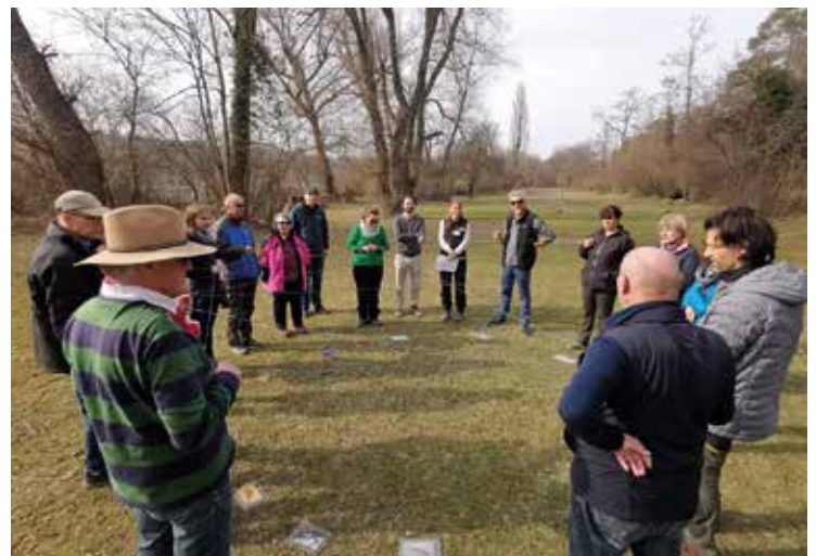
Die angehenden Exkursionsleiter hören gespannt zu

Programm für das kommende Jahr erwartet werden, das sicherlich um eine Vielzahl an interessanten Angeboten erweitert sein wird.