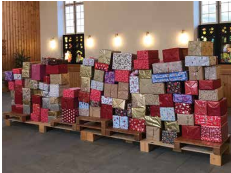
Zahlreiche Päckli für Ost- und Südosteuropa bilden eine grosse Mauer