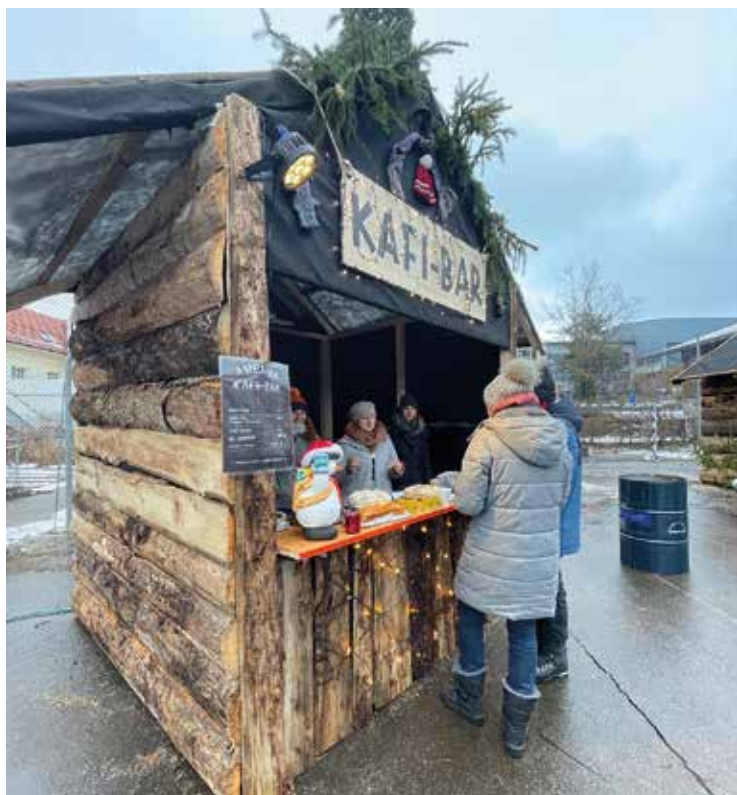
Kontakte pflegen an der Kafi-Bar.