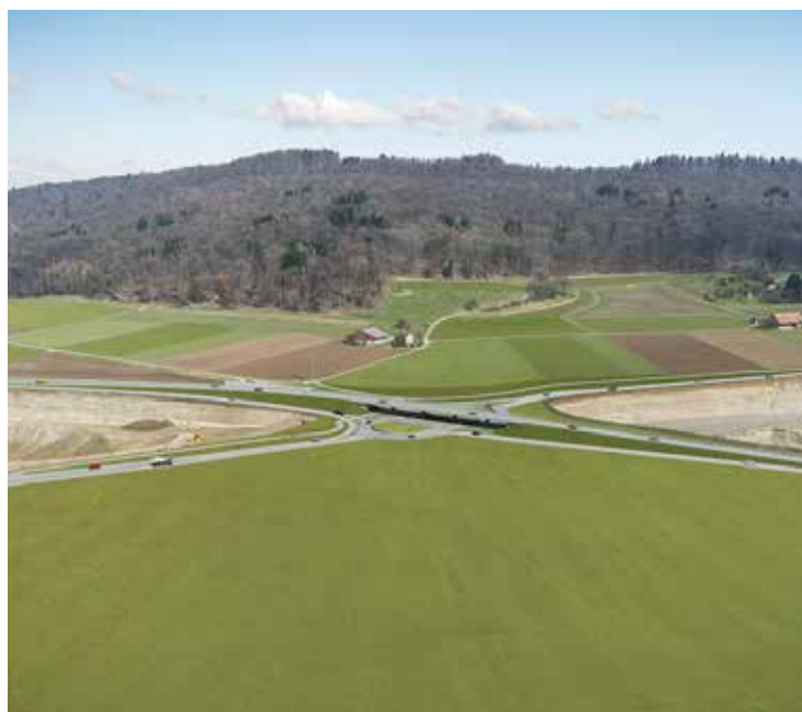
Der Kreisel im Hardwald wird ab Sommer 2022 umgebaut. Nötig wird das weil der Verkehr bis zum Jahr 2030 nochmals um 20 Prozent zunehmen wird.

Vorgängig zu den Bauarbeiten haben im Herbst 2021 Grabungen der Kantonsarchäologie stattgefunden. (r.)