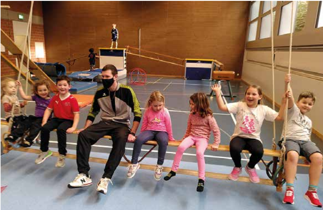
Strahlende Gesichter bei Kindern und den Betreuern an der Turnwelt in Buchberg.

Bereits zum zweiten Mal stand am zweiten Samstag des Jahres die Turnwelt auf dem Programm. Die Turnwelt soll dem Turnnachwuchs die Möglichkeit bieten, sich zu bewegen und Erfahrungen in der Turnhalle zu sammeln. Dies geschieht durch spannende und herausfordernde Bewegungslandschaften, welche von