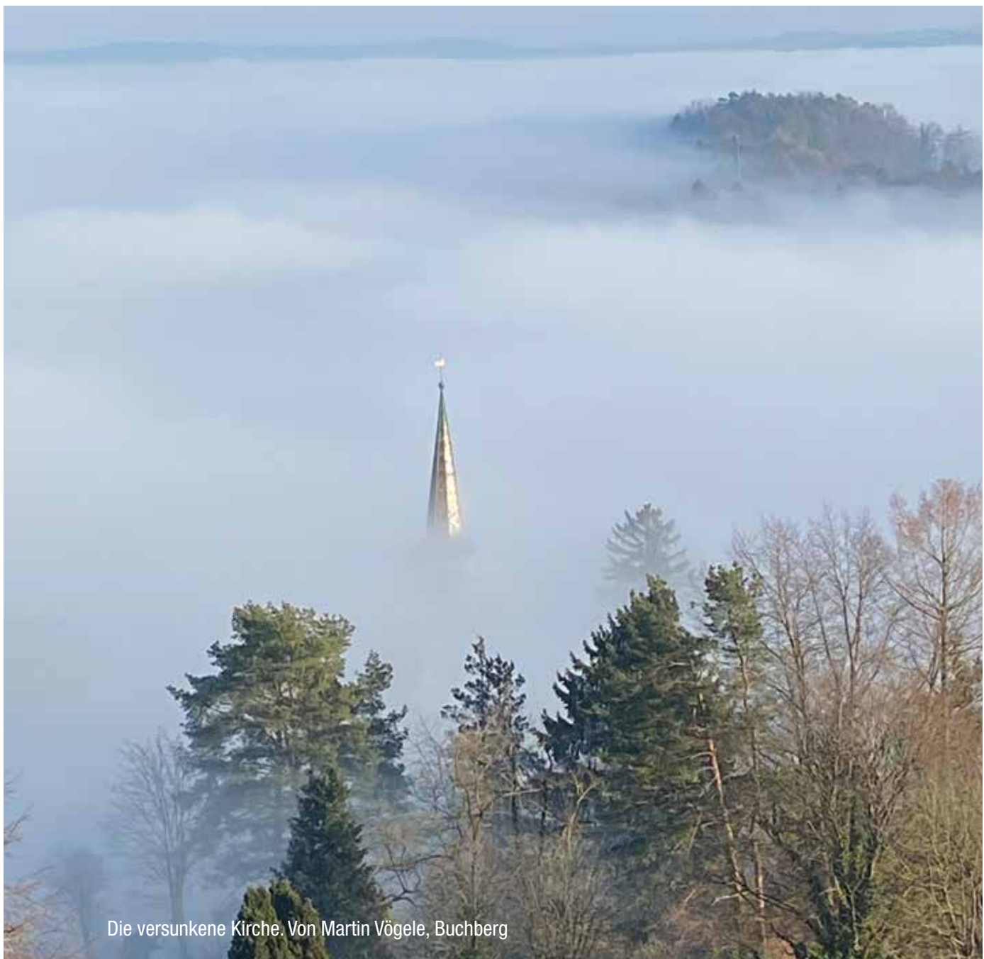
Die versunkene Kirche. Von Martin Vögele, Buchberg