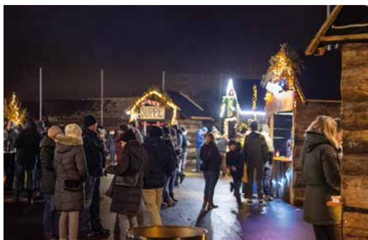
In 20 Arbeitsstunden wurde das Weihnachtsdorf erstellt.

Vielen Dank an alle, die wir begrüßen durften!