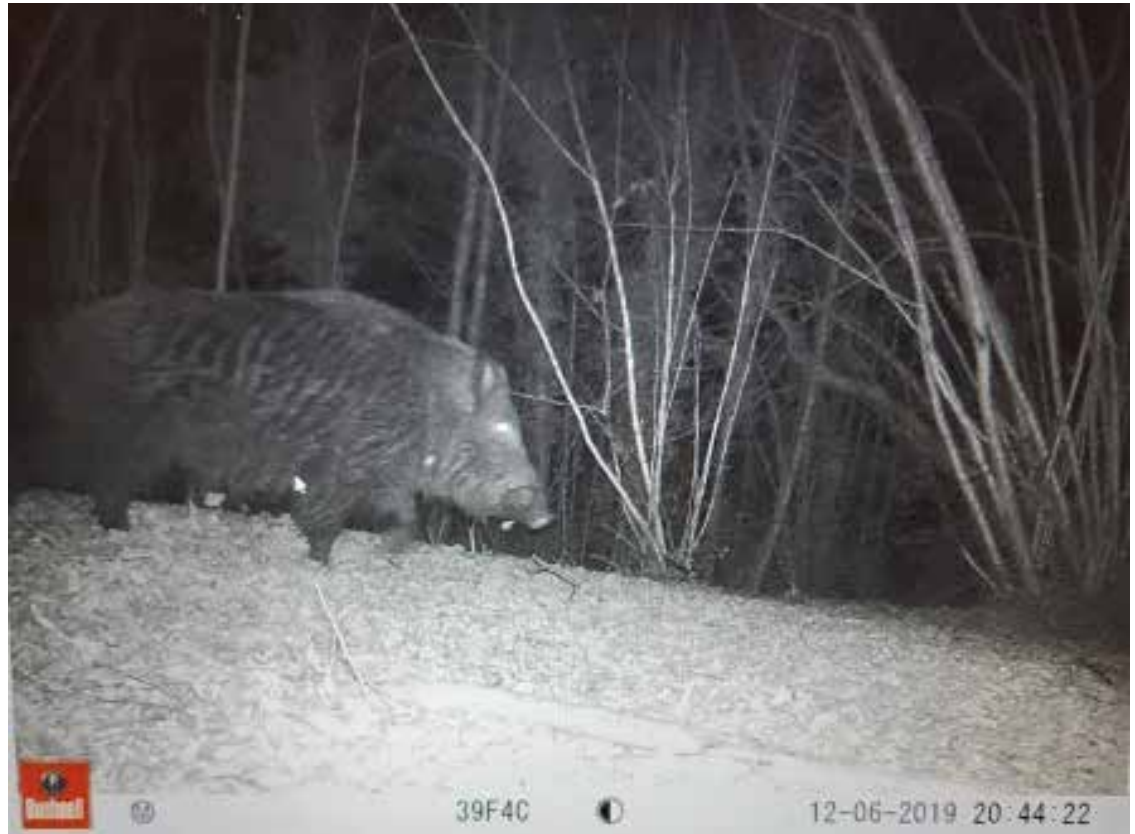
Wildschwein auf der Wildkamera nahe der deutschen Grenze

Zwischen Anfang Oktober und Ende Dezember finden Treibjagden statt. Daran nehmen um die dreissig Jägerinnen und Jäger teil. Die JG Reineke lädt befreundete Jäger, teils aus der ganzen Schweiz und auch von ennet der Grenze, ein. Sie pflegt einen guten Kontakt zu den Rafzerfelder Revieren und auch mit Lottstetten tauscht man sich regelmässig aus. Als Treiber können immer wieder Leute aus unseren Dörfern dazugewonnen werden, welche jedes Jahr wieder gerne zur Jagd kommen. So hat die JG Reineke mittlerweile einen festen Treiberstamm, welcher sich immer wieder auf die neuen Herbst-