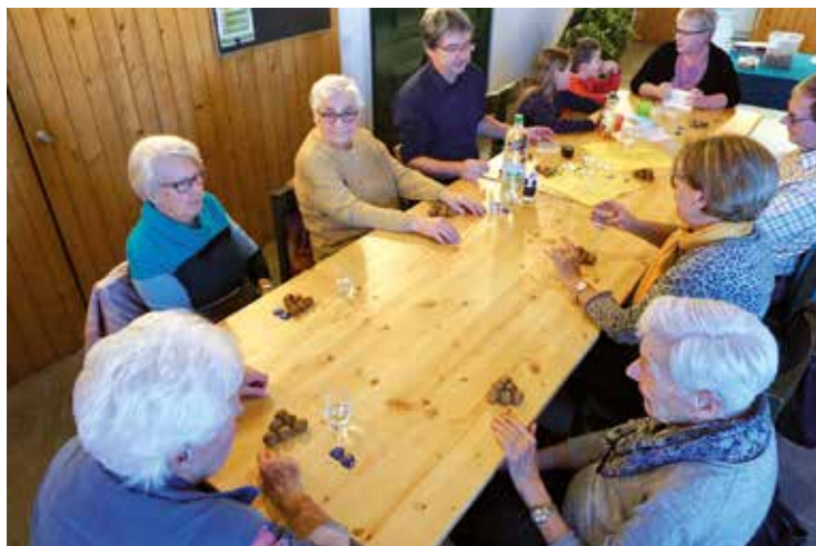
Die Senioren verbrachten einen vergnüglichen Nachmittag beim Spiel.

An diesem 12. Januar besuchten bloss 10 Gäste den Spielnachmittag. Viele der Stammgäste von früher waren zuhause ge-