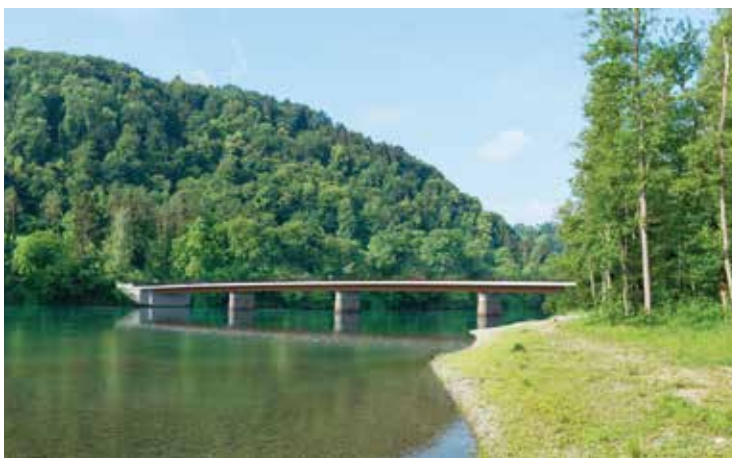
Visualisierung der Rheinbrücke zwischen Flaach und Rüdlingen.

total 120'000 Franken gekostet. Bei einem heutigen Kostenvolumen von 17,4 Millionen Franken mache das zwar einen Unterschied. Was aber auf den ersten Blick unfair aussehe, sei schon richtig, denn für den Kanton Zürich bilde die Brücke seit ihrer Inbetriebnahme 1872 eine wichtige