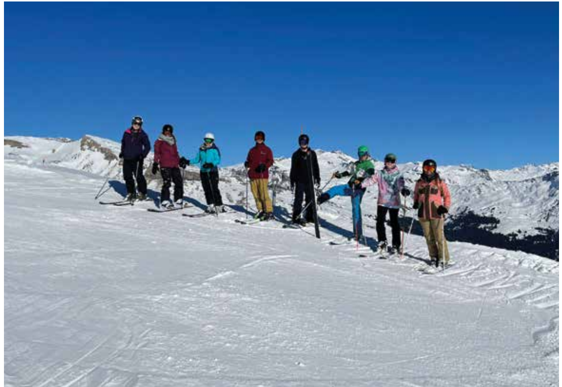
Strahlend schönes Wetter am Skiweekend des TV in Brigels.

Die Skifahrer schnallten sich die Skischuhe an die Füße, die