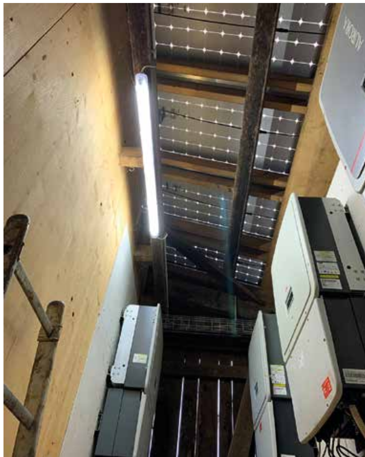
Blick auf die Solarpanels und den Wechselrichter, wo der Gleichstrom zu Wechselstrom umgewandelt wird.

Markus Simmler stellt sich vor, dass der erzeugte Strom wie Wasser durch eine Röhre mit Seitenarmen fliesst. Obwohl der Solarstrom bereits dem EKS ge-