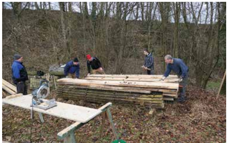
Abdecken, Hervorholen, Ablängen, neu Aufschichten und Zudecken, damit das Eschenholz für die DA VINCI Brücke rechtzeitig bereit ist.