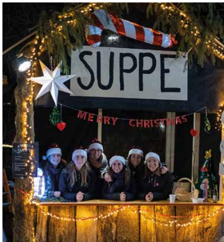
Mit einer Suppe konnte man der Kälte entgegen wirken.