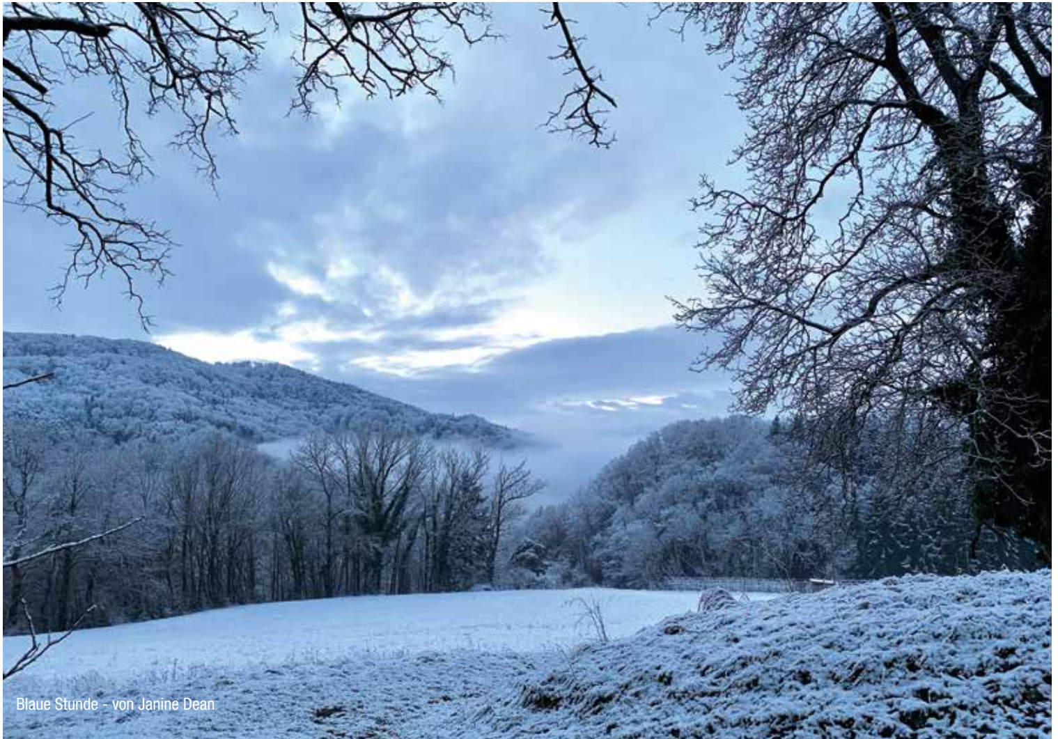
Blaue Stunde - von Janine Dean