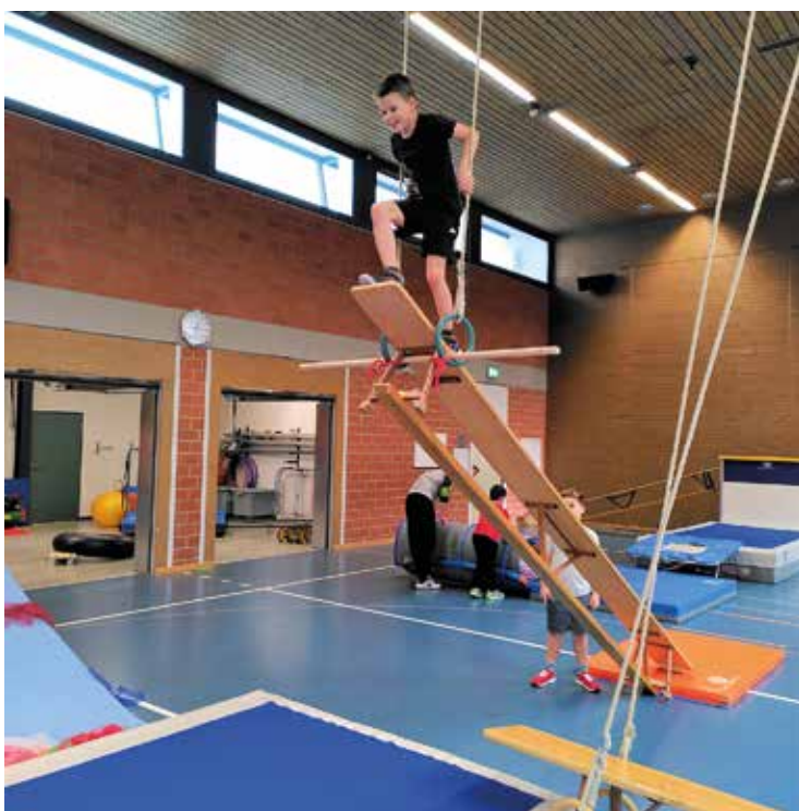
Über ein Hindernis zu klettern braucht Mut.