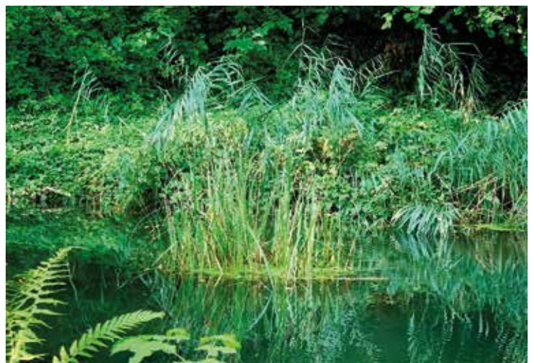
Weiher in Buchberg