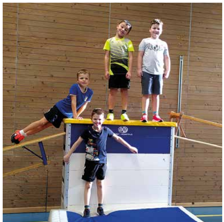
Fast wie ein Siebertreppchen...