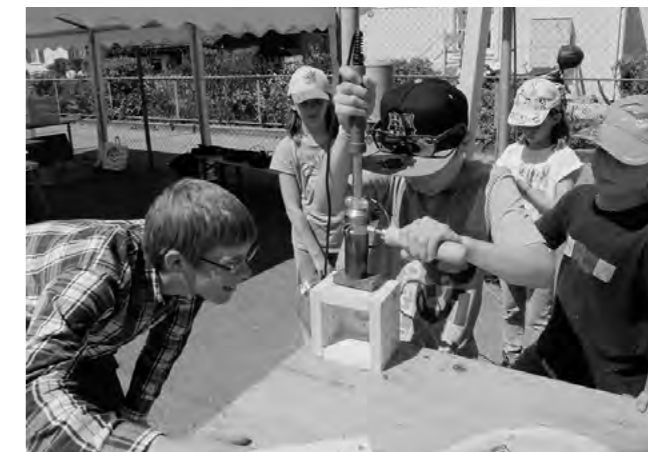
Einbrennen des Gattersagitempls auf ein gefertigtes Windlicht