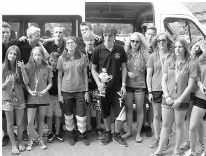
21 Sieger-Jugendfeuerwehler, müde aber glücklich!

das ganze Siegertreppchen für sich und belegten die Ränge 1, 2 und 3. Ein Wettkampf Team besteht aus einem Teamchef und sechs Jugendfeuerwehr Jungs und Mädchen. Ganz besonders beeindruckten die Zweitplatzierten. Es war ein reines Mädchenteam. Mit ihrer Kraft und Konzentration überraschten sie alle. In der gesamten Wettkampfgeschichte war noch nie ein reines Mädchenteam so erfolgreich gewesen. Natürlich wurden die Rückkehrer standesgemäss begrüsst. Im Steinenkreuz hatten sich zahlreiche Bewohner aus den beiden Gemeinden versammelt. Neben den Löschwagen der örtlichen Feuerwehr fand sich das grosse Löschfahrzeug des Stützpunktes Neuhausen. Von der langen Drehleiter sprühte ein Wasservorhang. Von allen Seiten wurden die Ankömmlinge mit Wasser, Rauch, Schellen und Hörnern gefeiert. Danach zog der Siegercorso weiter durch Rüdlingen und wieder hoch nach Buchberg, wo sie diesen ereignisvollen Tag gemütlich ausklingen lassen konnten.