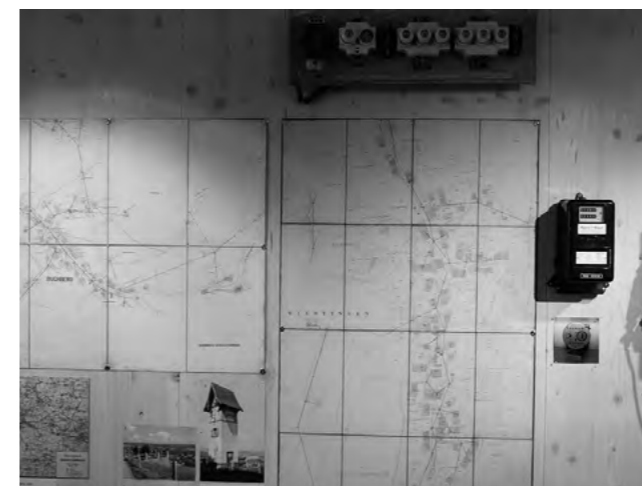
Pläne von 1912 von Buchberg und Rüdlingen mit den erstellten Leitungen und der Transformatoren-Station unterhalb der Kirche