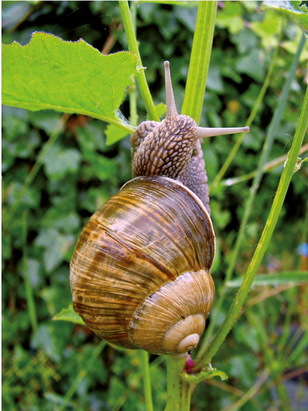
von Andrée Lanfranconi