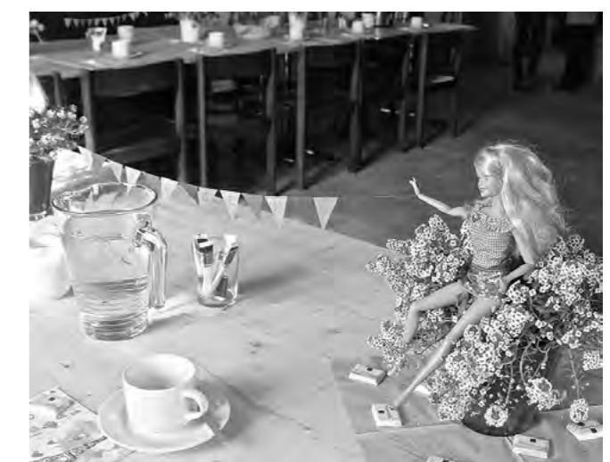
Makellos schön wie Barbie-Beine, Tischdekoration beim Frauezmorge