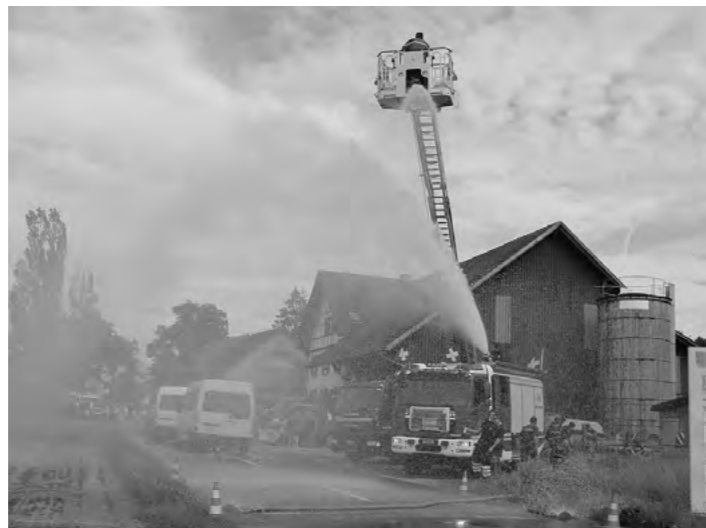
Wasser marsch! Im Steinenkreuz