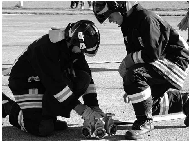
Schnell sind die Schläuche verlegt und aneinander gekuppelt. In Kürze kann die Löscharbeit beginnen.