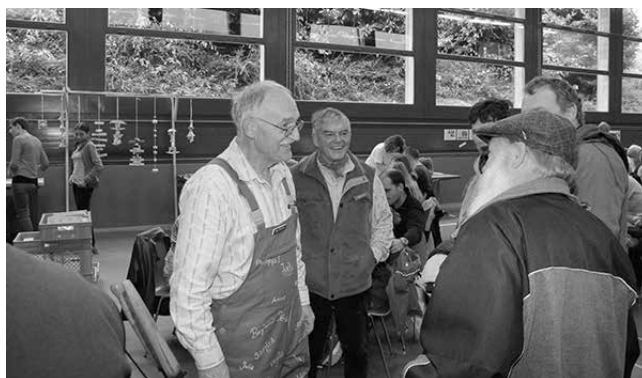
Gute Stimmung auf dem Werkplatz in der Festhalle