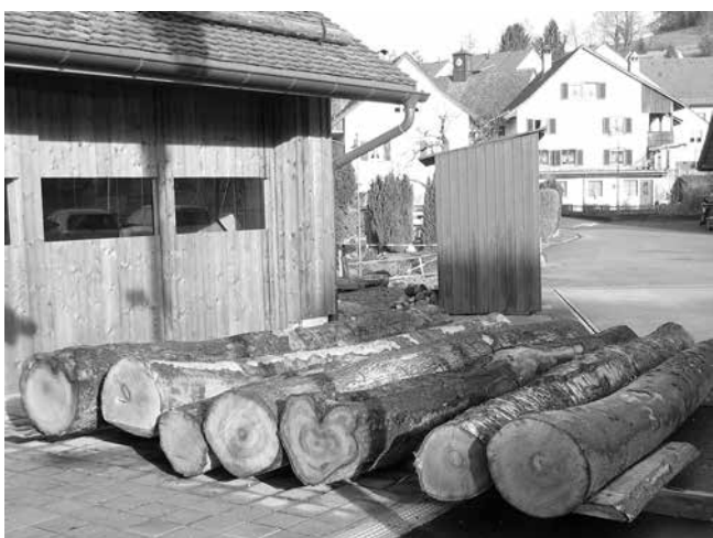
Die Stämme verschiedener Holzarten für die Treppe liegen 2011 bereit zum Sägen