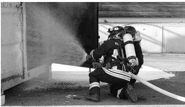
Der Brand wird mit Schaumlöscher bekämpft.