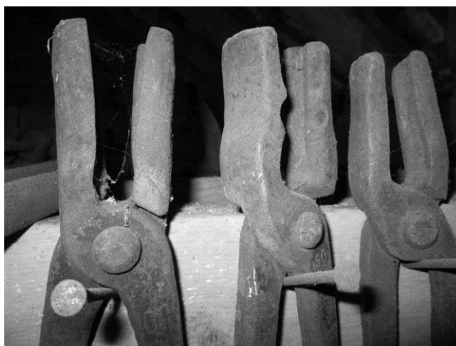
Schmiedezangen von Johann Fehr, Buchberg