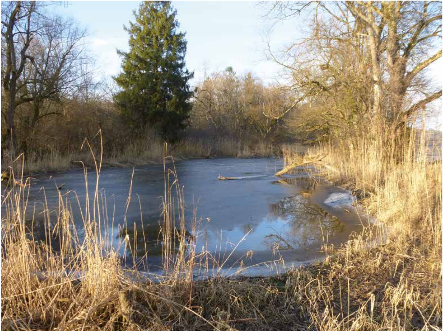
Frühlingsstimmung am alten Rhein von Peter Stucki