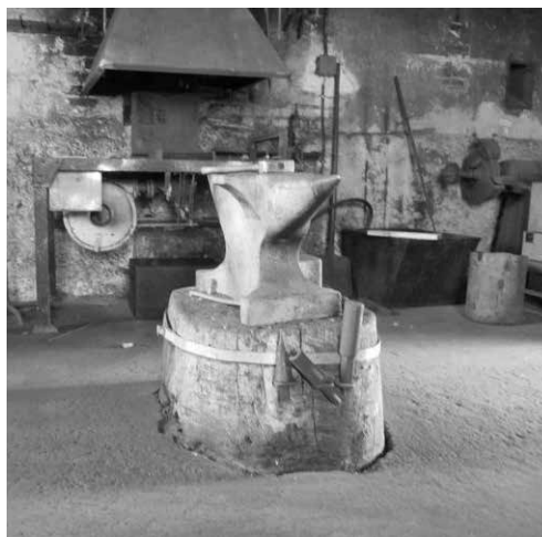
Amboss mit Hammer und Esse in der alten «Dorfschmitte» in Buchberg