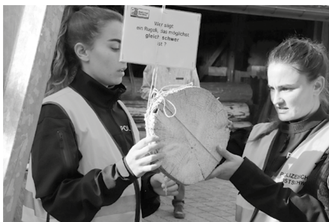
Angehende Polizistinnen beim Abschätzen der richtigen Rugelibreite

Während dem ganzen Nachmittag des 8. Oktober haben 84 PolizeischülerInnen aus der Ostschweiz inkl. Kanton SH anlässlich der Klassenbildungstage einen Postenlauf absolviert. Ziel jeder Gruppe à 14 Personen am Posten 3 war, in Zweierteams mit einer Hobelzahnsäge von einem Baumstamm das vorgezeigte Gewicht möglichst genau abzusägen. Daneben gab es eine Kurzführung über die Säger-Ausstellung und die Gattersagi und eine Sägerdemo. Es war der grösste Anlass in der Gattersagi in diesem Jahr. Die Ausbilder haben sich sehr positiv geäussert zum Ablauf und wollen die Zusammenarbeit im nächsten Jahr fortsetzen.