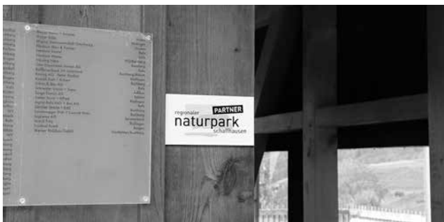
Jetzt sind wir Partner des regionalen Naturparks Schaffhausen

netzt. Diese regelt mehrere Bereiche der Zusammenarbeit. Projekte wie das Gattersagi-Beetli könnten unter Einhaltung der Regeln mit dem Naturpark-Label zertifiziert werden. Da wir kein Produktionsbetrieb sind, haben wir vorläufig auf eine Zertifizierung verzichtet. Informations- und Werbemaßnahmen des Vereins pro Gattersagi werden nun durch den Naturpark bevorzugt behandelt. Inzwischen haben wir ein Schild erhalten, das neben dem Eingang in die Gattersagi auf die Partnerschaft hinweist.