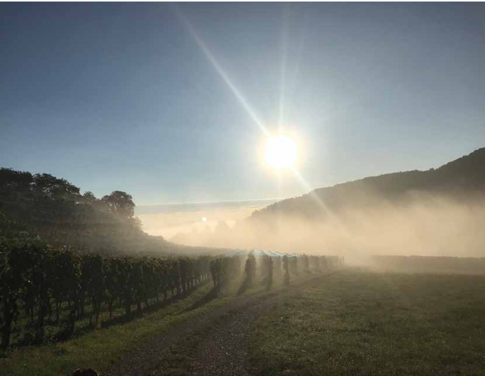
Morgennebel