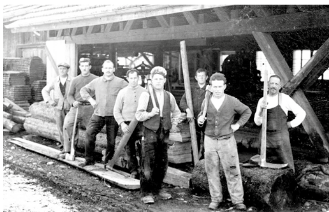
Sägemannschaft vor einer Säge im Raum Zürich 1917

Die ausgebildeten Säger und Sägerinnen der Holzindustrie übernehmen die Verantwortung für den optimalen Arbeitsablauf, die Qualitätskontrolle, die Einhaltung der Termine, die Arbeitssicherheit und die Beratung der Kundschaft. Sie kennen sich aus in der Qualität und den Eigenschaften des Holzes mit mechanischen und schnittechnischen Betriebsabläufen sowie der Weiterveredelung zu Halbfertigprodukten. Sie planen, organisieren, beraten, rechnen, kontrollieren, markieren, schneiden, schärfen, stapeln, dämpfen, trocknen, sortieren und verladen. Ein Kurzfilm von Otto Haller zeigt ergänzend zu der Ausstellung interessante Ausschnitte über den Sägerberuf.