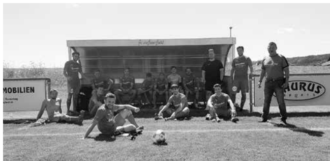
Erstes Testspiel daheim gegen FC Dielsdorf (5:1)