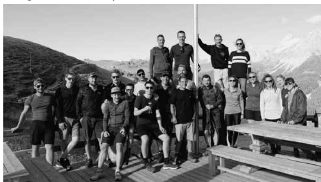
Eindruck aus dem diesjährigen Besuch in Arosa

Wir wünschen allen Vereinen in Buchberg – Rüdlingen ein erfolgreiches Vereinsjahr.