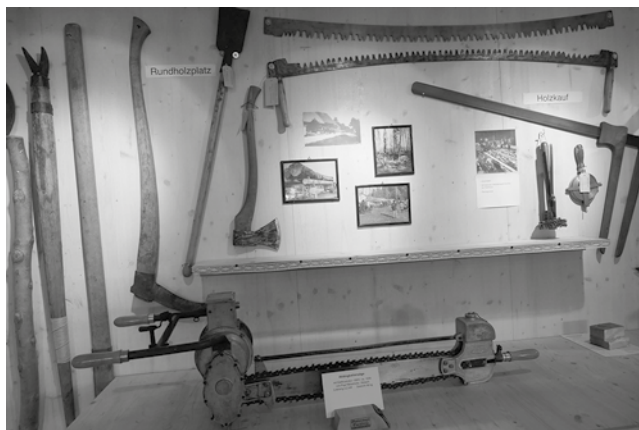
Ausschnitt aus der neuen Ausstellung «Säger»