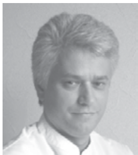
S. Rusconi Hüntwangen

10'000 Heilmittel, Drogerieartikel für Sie an Lager. Wir bestellen für Sie weitere 40'000 Artikel in 24 h!