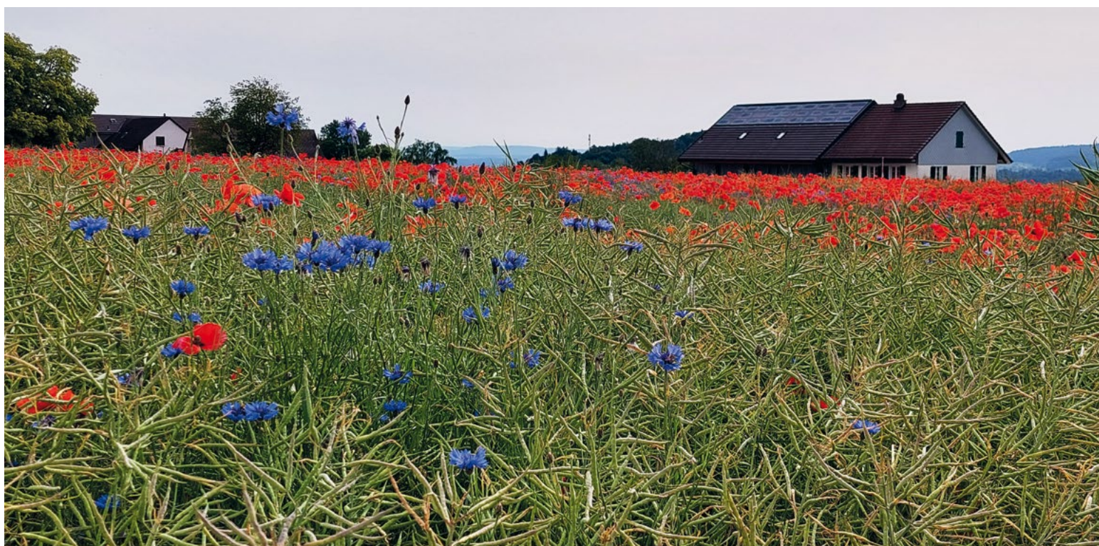
Wunderschöne Mohn- und Kornblumen