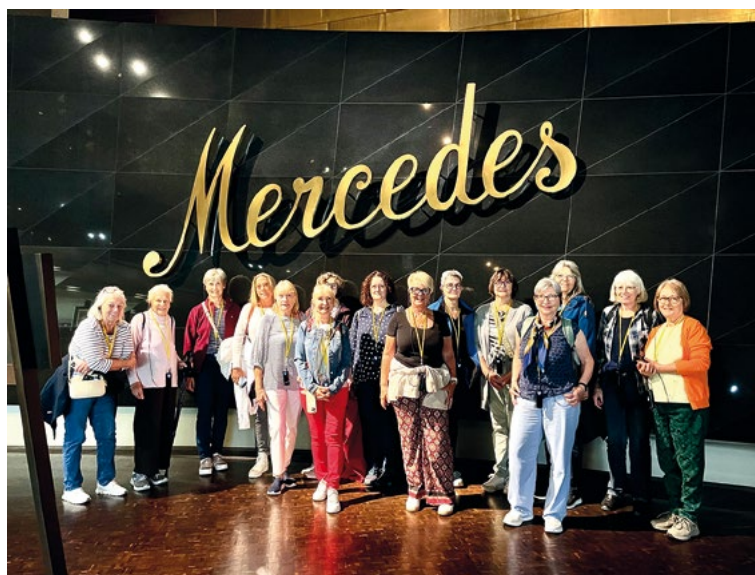
Die Landfrauen in Stuttgart

Bereits um neun Uhr kamen wir in Stuttgart beim Museum an und konnten das imposante Gebäude bewundern. Die Führung durch das Automuseum begann kurz danach und wir wurden in zwei Gruppen aufgeteilt. Die Männer und eine der Frauen entschieden sich für die eher technisch orientierte Tour. Die Frauen nahmen an der Führung teil, welche die Verdienste von Frauen in der Geschichte des Automobils hervorhoben. Es war erstaunlich zu