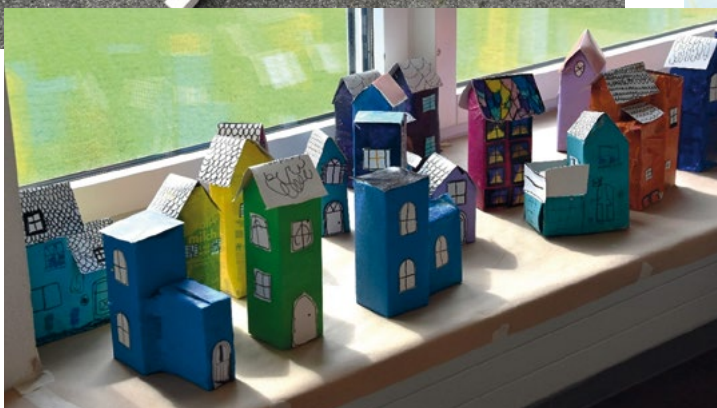
Tetra Pack Häuser