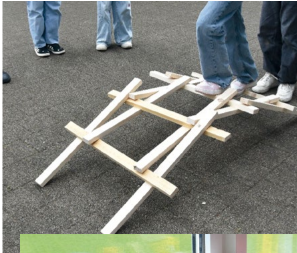
Da Vinci Brücke