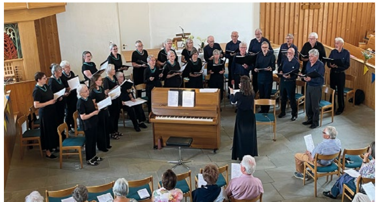
Gemischter Chor Rheinklang in der Kirche Buchberg-Rüdlingen mit Publikum

dankte sich bei den anwesenden Zuhörerinnen und Zuhörern, sowie allen Mitwirkenden und Sponsoren. Zum Ausklang stand ein Apéro in der Aula der Kirche Buchberg-Rüdlingen bereit, damit man noch ein bisschen ver-