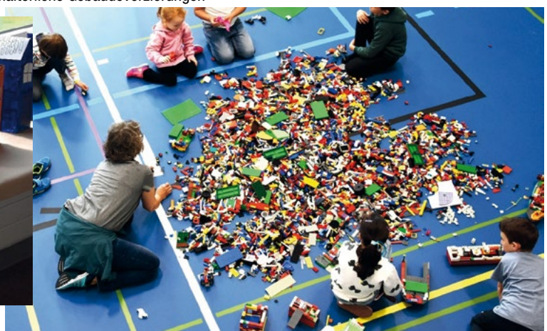
Hier entsteht eine Legostadt