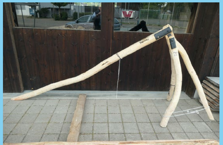
Innerhalb einer guten Woche hat Ruedi Meyer den neuen Schmierbock hergestellt.

Die vertrockneten, schwarzen Resten Fett vom Vorjahr waren nicht Abfall. Sie wurden gegen einen gefürchteten Obstbaumschädling, den Frostspanner verwendet: Vermischt mit Oel gab es eine dickflüssige Masse, die auf einen Papierstreifen aufgetragen und ca. 1 Meter über Boden um die Obstbäume gebunden wurde. Wie bei den alten Eisenteilen für den Schmierbock war das sinnvolle Abfallbewirtschaftung im Zeitalter, bevor Pflanzenschutzmittel verfügbar waren.