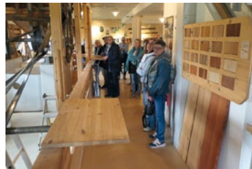
Besucherinnen bestaunen die laufende Gattersagi im Untergeschoss