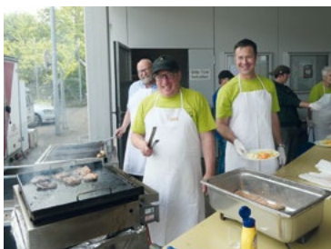
Freudig sorgen zwei Neumitglieder und ein Gemeinderat für das leibliche Wohl