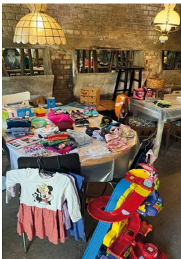
Bunte Vielfalt gab es am Bring- und Holtage in Buchberg

Rund 40 Personen nutzten das Angebot. Dieses war auch in diesem Jahr vielfältig: Von Kinderspielsachen und Kinderkleidern über Bücher, Haushaltsartikel und