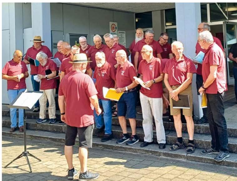
Eine Erinnerung an das Fyyraabig-Konzert im letzten Jahr