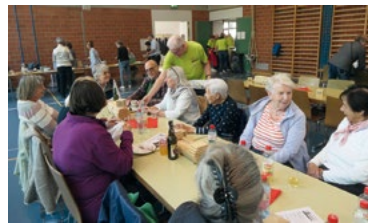
Der Aktuar ist im Service