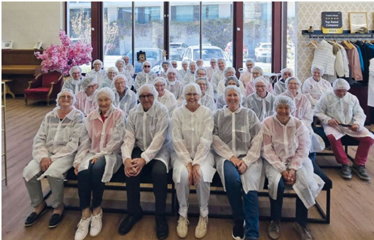
Für die Besichtigung der Manufaktur werden die Besuchenden mit hygienischen Mänteln, Häubchen und Schuhschutz ausgerüstet.

Eine Gruppe von Seniorinnen und Senioren aus Buchberg und Rüdlingen besuchte Ende April die Gemeinde Gottlieben am Seerhein. Die Fahrt mit Moser Car, an einem wunderschönen Frühlingstag, führte an Stein am Rhein vorbei, dem Untersee entlang über Steckborn und Ermatingen nach Gottlieben.