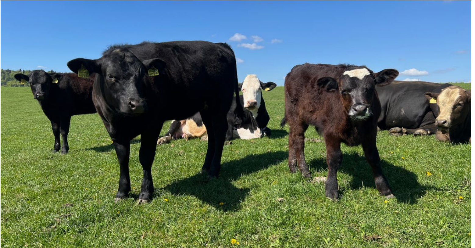
Auf der Weide legen die Kälber zusammen mit der Herde täglich einige Kilometer zurück. Raylee (2.v.l.) wird es dabei nie langweilig: Sie kann fressen, trinken, die Welt erkunden und sogar auf einem Spielplatz spielen.

das unter Umständen immer wieder. Damit steigt auch das Risiko für einen Verkehrsunfall. Und die Tiere wieder einzufangen, ist für Mensch und Tier ein grosser Stress.»