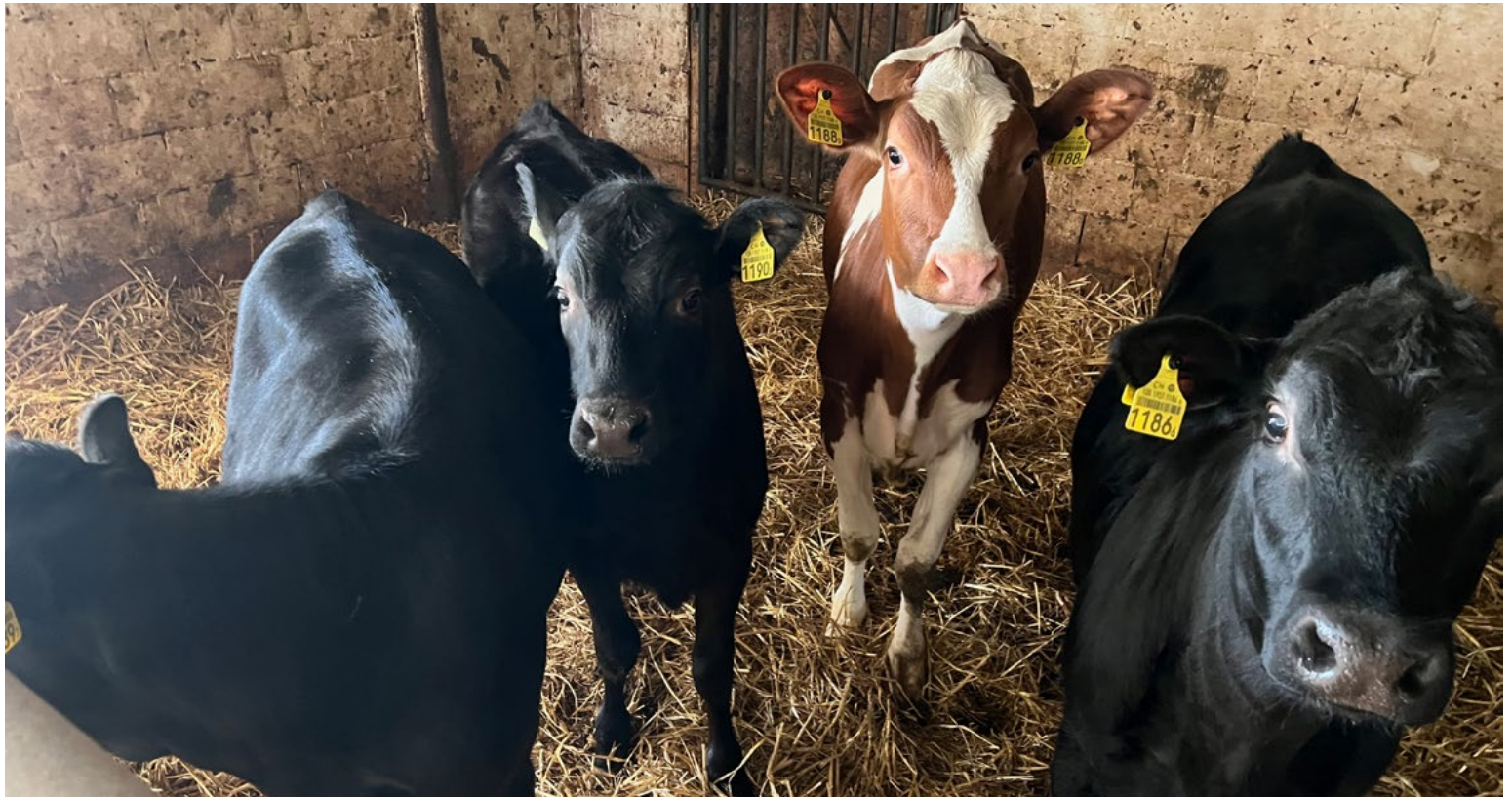
Amelie (2.v.r.) ist zwar nicht das älteste der vier Kälbchen, aber das grösste. Sie ist als Milchkuh vorgesehen, deswegen wurde sie mittels gesextem weiblichen Samen gezeugt. Bilder klü