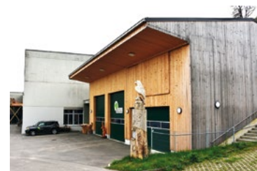
Werkgebäude in Hüntwangen