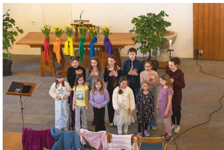
Der Rainbowchor hatte mit den Kindern des Pop-Up Chors erst kurz vor dem Gottesdienst gepöbt - das Ergebnis konnte sich sehen lassen.