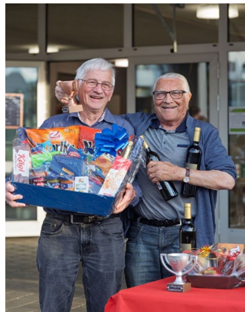
3. Preis für Team Silberfuchs (4373 Punkte)

Zum ersten, und hoffentlich nicht zum letzten Mal, fand am 18. April 2026 ein Jassturnier in der Mehrzweckhalle Buchberg statt.