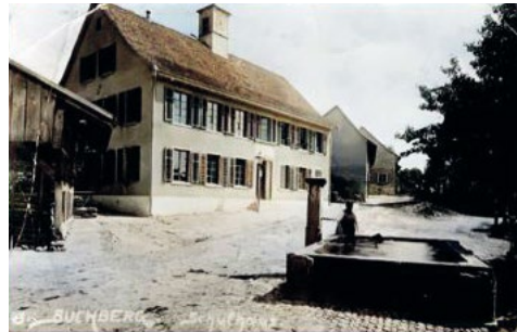
Schule Buchberg 1956