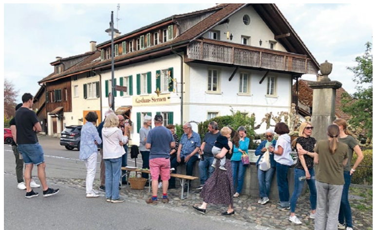
Friedliche Stimmung an diesem wunderbaren Frühlingsabend vor dem imposanten «Stern».