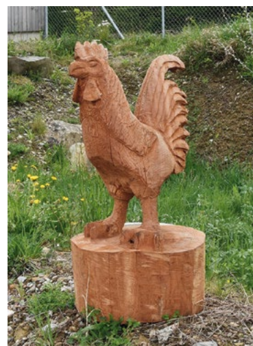
Solche vom Forstteam selber geschnitzte Figuren aus einheimischem Holz können beim Forstbetrieb erworben werden.

ten, Massivholzmöbel, Strassenunterhalt, Neophytenbekämpfung, sowie der Bau von Feuerstellen und Erholungsanlagen. Trotz der vielen spannenden Arbeiten bleibt der Forstbetrieb stark witterungsabhängig.