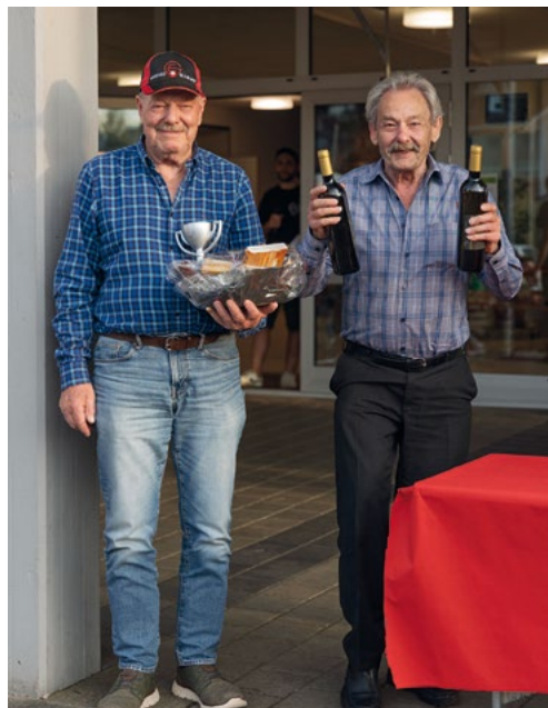
2. Preis für Team Matzinger (4482 Punkte)