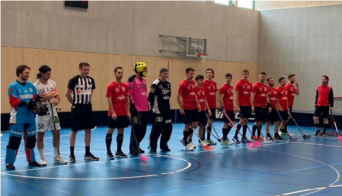
Das siegreiche Traktor 1 - Team. Ihr seid grossartig!

noch Resultatkosmetik, zu wenig Zeit befand sich noch auf der Uhr, zu souverän und abgeklärt kämpften sich die Traktoren hier in Richtung Schlusspfiff. Und so brachen sie an, die letzten 10 Sekunden dieses Spiels, dieser unglaublich spannenden und umkämpften Serie, dieser fantastischen Saison. 10, 9, 8, 7, 6, 5, 4, 3, 2, 1 – wer nöd gumpft, dä isch kein Traktor..... Die Schluss sirene ertönte, erlöste alle in der Halle, die es mit den Traktoren hielten und bedeutete gleichzeitig: Aufstieg!