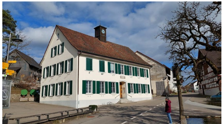
Heute ist es unser Gemeindehaus