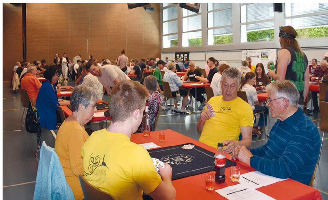
Halb Buchberg und Rüdlingen bewiesen ihr Können am 1. Jassturnier.

Das Jassturnier war ein grosser Erfolg, jeder Haushalt in Buchberg und Rüdlingen,... Fortsetzung Seite 5