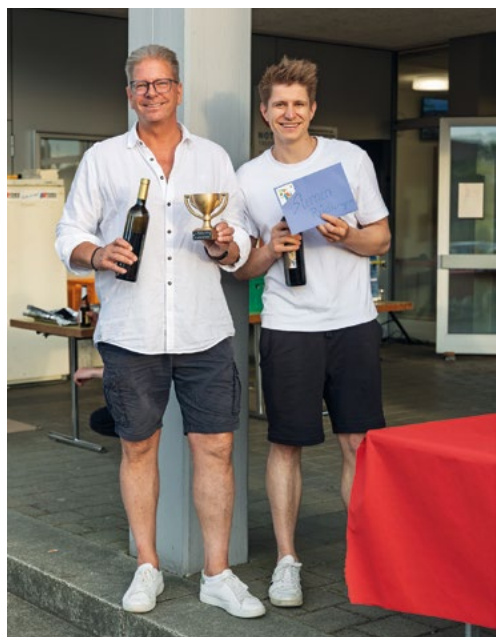
1. Preis für Team Bickelbello (4776 Punkte)

Gray Lackey hat die strahlenden Sieger des Jassturniers fotografiert.